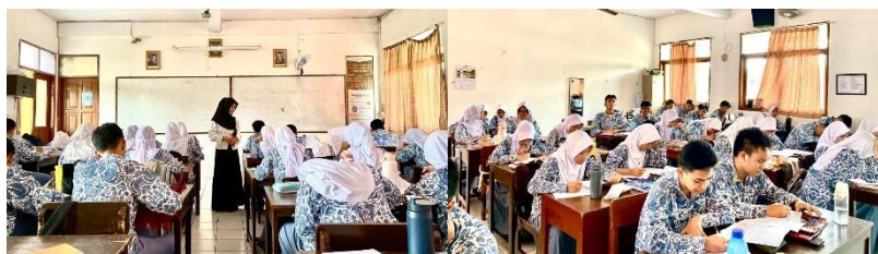
Gambar 3. 16 Pelaksanaan Posttest Kelas Kontrol X-3