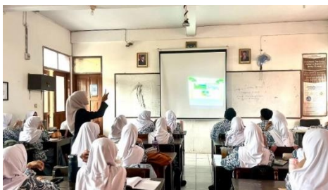
Gambar 3. 12 Kegiatan Pendahuluan Kelas Kontrol Pertemuan Ke-1

Kemudian dilanjutkan dengan kegiatan inti yang mengimplementasikan sintaks model problem based learning yang terdapat pada Gambar 3.13. Pada tahap pertama, guru menyajikan permasalahan lingkungan yang terjadi di Tasikmalaya, yaitu ikan khas Sungai Citanduy dan Ciwulan menuju kepunahan (Gambar a). Selanjutnya, guru mengorganisasikan peserta didik dengan membentuk kelompok agar peserta didik dapat menyusun rancangan penyelidikan berdasarkan fenomena yang diberikan (Gambar b). Dalam prosesnya guru membimbing proses penyelidikan supaya peserta didik mampu memilah informasi dari sumber yang valid dan kredibel (Gambar c). Pada tahap mengembangkan dan menyajikan hasil karya, peserta didik menyampaikan hasil diskusi melalui kegiatan presentasi, kemudian dilanjutkan dengan diskusi kelas guna merumuskan alternatif solusi (Gambar d). Setelah itu, tahap menganalisis dan mengevaluasi proses pemecahan masalah dilakukan dengan mempertimbangkan kekurangan dan kelebihan solusi yang telah dikemukakan (Gambar e).