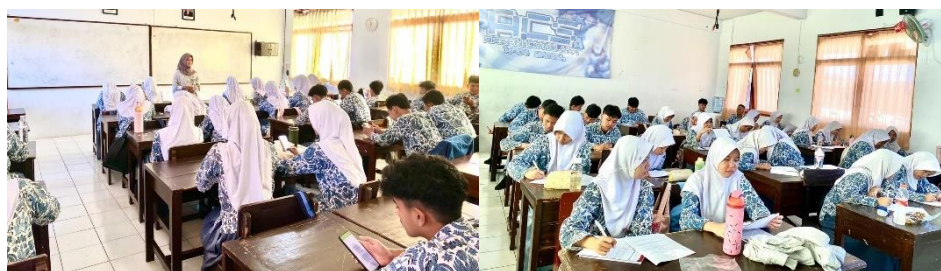
Gambar 3. 5 Pelaksanaan Pretest Kelas Eksperimen X-4