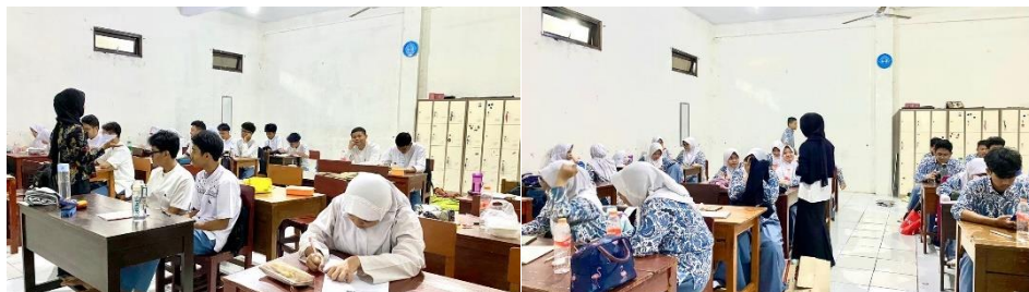
Gambar 3. 4 Uji Coba Instrumen