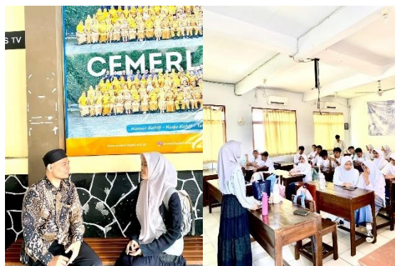
Gambar 3. 2 Wawancara dengan Guru Biologi dan Peserta Didik