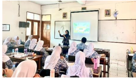
Gambar 3. 14 Kegiatan Pendahuluan Kelas Kontrol Pertemuan Ke-2

Pembelajaran kemudian dilanjutkan pada kegiatan inti dengan menerapkan sintaks model problem based learning sebagaimana ditunjukkan pada Gambar 3.15. Tahapan pembelajaran dilaksanakan sama seperti pada pertemuan pertama, dengan perbedaan terletak pada submateri dan permasalahan yang disajikan. Permasalahan tersebut disesuaikan dengan kondisi di Kota Tasikmalaya, di mana guru menyajikan permasalahan lingkungan yang terjadi di wilayah tersebut, yaitu alih fungsi lahan pertanian di Tasikmalaya.