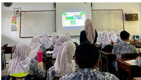
Gambar 3. 6 Kegiatan Pendahuluan Kelas Eksperimen Pertemuan Ke-1

pendahuluan yang mencakup beberapa langkah, yaitu kegiatan pembuka, apersepsi, pemberian motivasi, penyampaian tujuan pembelajaran, serta penjelasan alur pembelajaran sebagaimana ditunjukkan pada Gambar 3.6.