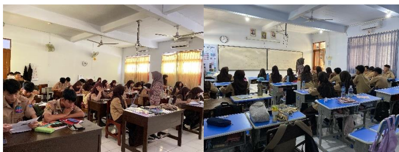
Gambar 3. 3 Studi Pendahuluan di Kelas X SMAN 1 Tasikmalaya