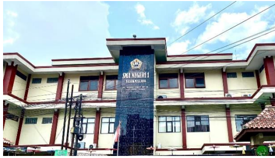
Gambar 3. 17 SMAN 1 Tasikmalaya