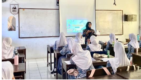
Gambar 3. 8 Kegiatan Pendahuluan Kelas Eksperimen Pertemuan Ke-2

motivasi, penyampaian tujuan pembelajaran, serta penjelasan alur pembelajaran sebagaimana ditunjukkan pada Gambar 3.8.