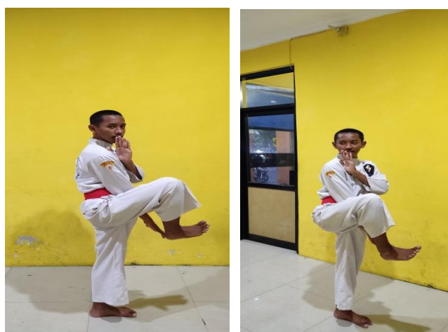
Gambar 2. 6 Angkatan Lutut

Dengan sikap posisi kuda-kuda samping angkat lutut kaki depan atau belakang ke arah depan, kaki yang satunya di luruskan dan menjadi tumpuan. Berikut adalah contoh angkatan lutut pada saat melakukan tendangan T.