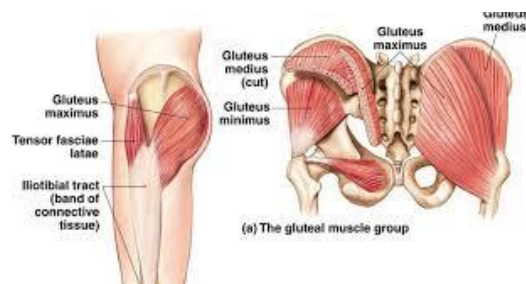
Gambar 2. 4 Otot Panggul

Otot di bagian belakang panggul, khususnya otot gluteus maximus adapun menurut Wirasasmita, Ricki (2014) menyatakan bahwa otot gelang panggul ( muscle pelvis ) terdiri dari otot bokong besar ( gluteus maximus m ), otot bokong tengah ( gluteus medius m ), otot bokong kecil ( gluteus minimus m ), muscle psoas yang melekat pada coxa os , otot penegak selaput otot lebar ( tensor fasciae latae m ), otot gluteus ke tiga berfungsi dalam gerakan ekstensi dari extremitas inferior , sedangkan muscle psoas dan muscle tensor fasciae latae berfungsi untuk gerakan fleksi dan extremitas inferior (hlm.26).