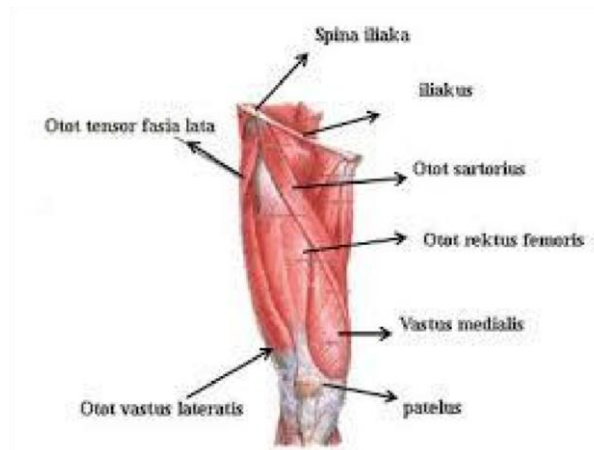
Gambar 2. 1 Otot Tungkai Atas