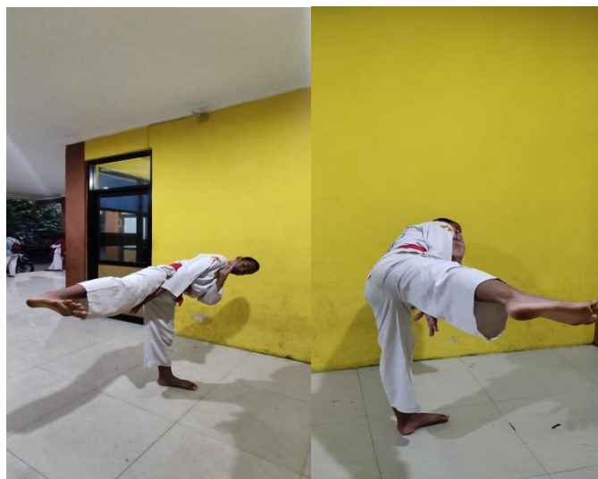
Gambar 2. 7 Tendangan T

Lakukan tendangan T dengan dorongan kedepan dengan perkenaan menggunakan samping telapak kaki arahkan ke uluh hati atau dada, tangan satu di dada dan tangan satunya di bawah atau bersikap putri bersedia untuk menyeimbangkan tubuh, kaki belakang itu sebagai tumpuan menahan agar tubuh tidak goyang, setelah melakukan tendangan bisa di tarik kembali ke belakang atau melangkah ke depan. Untuk lebih jelasnya daat dilihat berikut adalah contoh tendangan depan pencak silat.