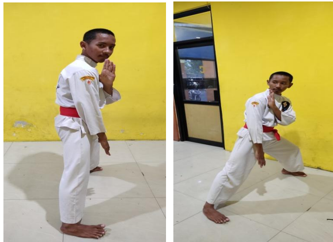
Gambar 2. 5 Kuda-kuda Samping Sumber: (Dokumentasi Pribadi)

Otot yang berkontraksi pada saat melakukan kuda-kuda yaitu otot yang berperan otot pada panggul sangat diperlukan untuk melakukan gerakan yang luas, selanjutnya otot paha ( muscle femoris ) dan otot betis yang diperlukan saat melakukan kuda-kuda yaitu urat akiles ( tendo Achilles ) fungsinya meluruskan kaki sendi lutut dan membengkokkan tungkai bawah lutut ( muscle popliteus ).