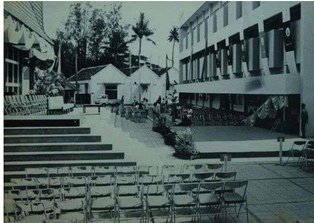
Gambar 3.15 Lembaga Pendidikan Kesenian Jakarta (kini IKJ)

(kini IKJ). Kehadiran institusi pendidikan ini semakin memperluas fungsi TIM, tidak hanya sebagai tempat pementasan, tetapi juga sebagai pusat pendidikan dan pembinaan tenaga seni. Dengan keberadaan IKJ, TIM berkembang sebagai kawasan yang memadukan fungsi pertunjukan, kelembagaan kesenian melalui Dewan Kesenian Jakarta, dan pendidikan seni dalam satu lingkungan terpadu. 65