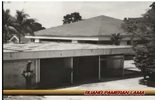
Gambar 3.9 Ruang Pameran Lama