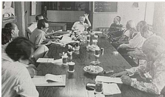
Gambar 3.3 Sidang Pleno Akademi Jakarta yang dihadiri oleh wakil Pemerintah DKI Jakarta, perwakilan DKJ, dan anggota AJ di VIP Room pada bulan Juli 1977.

Akademi Jakarta (AJ) merupakan lembaga kehormatan di dunia kesenian yang beranggotakan sepuluh tokoh seniman dan budayawan Indonesia terkemuka untuk seumur hidup. Tugas Akademi Jakarta adalah memberikan saran dan pertimbangan kepada Gubernur DKI Jakarta mengenai masalah seni dan kebudayaan, seperti memilih anggota, mengarahkan dan mengevaluasi program DKJ dan memberi Anugerah Seni kepada seniman-seniman Indonesia terbaik. Seniman penerima Anugerah Seni Akademi Jakarta antara lain adalah Rendra pada tahun 1975 dan Zaini pada tahun 1978. 56 Para anggota Akademi Jakarta pertama kali dipilih oleh DKJ dan dikukuhkan oleh Gubernur Ali Sadikin. Namun untuk selanjutnya mereka akan dipilih oleh Akademi Jakarta sendiri. Almarhum Affandi (pelukis), Mohammad Said (pendidik), Djadug Djajakusuma (sutradara), dan Soedjatmoko (cendekiawan terkenal) pernah menjadi anggota Akademi Jakarta. 57