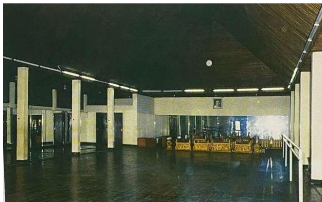
Gambar 3.12 Sanggar Tari Huriah Adam