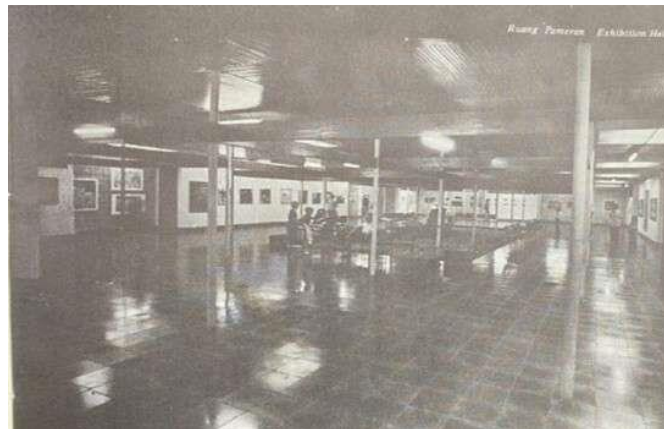
Gambar 3.10 Ruang Pameran Utama