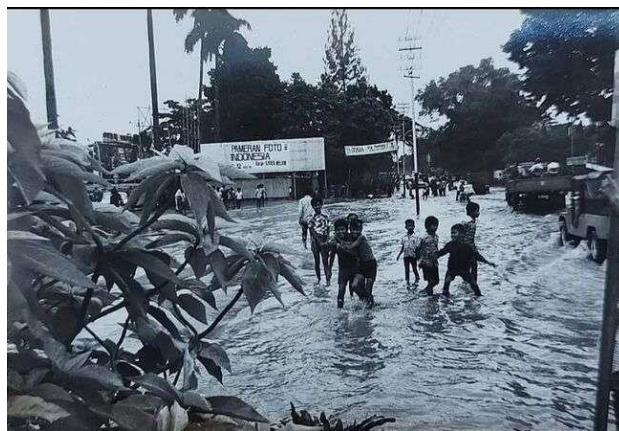
Gambar 3.16 Kawasan Depan TIM Banjir pada Tahun 1975

kota Jakarta yang menghadapi persoalan infrastruktur dan lingkungan. Peristiwa banjir tahun 1975 juga menunjukkan bahwa pengelolaan fasilitas kesenian tidak hanya berkaitan dengan penyediaan gedung pertunjukan, ruang pameran, dan sarana teknis lainnya, tetapi turut bersentuhan dengan kondisi alam dan tata kota. Setelah genangan air surut, pengelola bersama pihak terkait melakukan pembersihan serta penataan kembali ruang-ruang yang terdampak agar kegiatan kesenian dapat berjalan seperti semula. Aktivitas pertunjukan dan pameran kemudian kembali dilaksanakan secara bertahap. 67