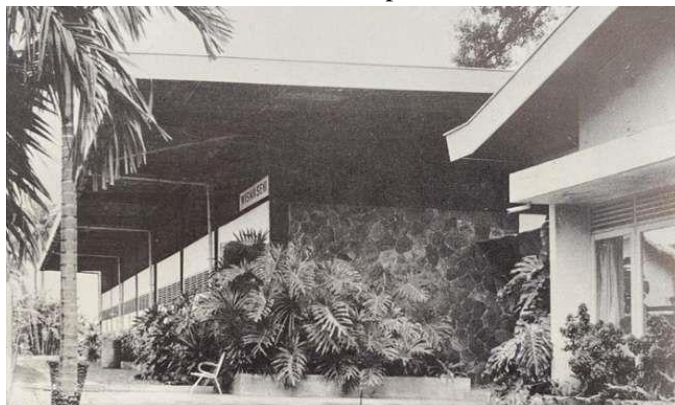
Gambar 3.13 Wisma Seni