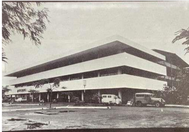
Gambar 3.4 Teater Besar

Terdapat pula Teater Terbuka yang dapat menampung hingga 3.000 orang penonton, duduk di atas bangku kayu di bawah langit terbuka. Di panggung yang luas ini pernah dipentaskan berbagai pertunjukan yang diperkirakan mendapat perhatian masyarakat secara luas, seperti gambang kromong dan lenong (bentuk kesenian Betawi), ketoprak dan ludruk (bentuk kesenian Jawa), srimulat (dari Surabaya), gending karesemen (dari Sunda), tarling (dari Cirebon), randai (dari Minangkabau), dan berbagai kesenian rakyat daerah lainnya seperti dari Kalimantan, Sulawesi, Aceh, dan lainnya. Di sini juga pernah dipentaskan berbagai jenis kesenian asing seperti ballet (dari Perancis, Jerman, Belanda), konser musik dan ballet (dari Amerika, Australia, Perancis, dan Jerman). Dan pementasan teater kontemporer yang diselenggarakan oleh Bengkel Teater seperti Kasidah Barjanzi. 60