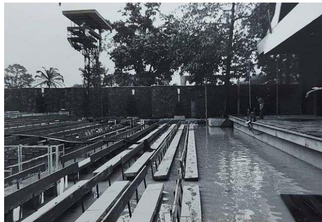
Gambar 3.17 Teater Arena Banjir pada Tahun 1975

Situasi tersebut juga dapat dipahami melalui konsep ruang publik yang dikemukakan oleh Jurgen Habermas. Dalam pandangan Habermas, ruang publik merupakan tempat di mana masyarakat dapat berkumpul, berinteraksi, dan bertukar gagasan