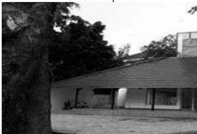
Gambar 3.14 Masjid Amir Hamzah