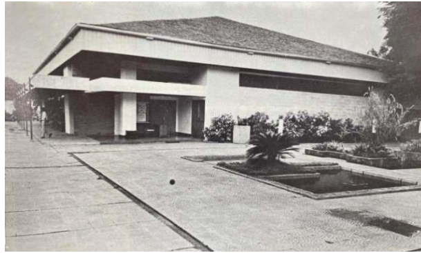
3.7 Teater Arena

Pada bagian belakang Teater Besar, terdapat Teater Halaman yang dipergunakan untuk kesenian rakyat dan remaja. Tarian Melayu, musik underground , dan berbagai kabaret (pertunjukan teater hiburan yang bersifat campuran dan sering mengandung kritik sosial atau sindiran) juga pernah dipertunjukkan di teater ini. Sesuai dengan namanya, teater ini terbuka sehingga para penonton dapat menyaksikan pertunjukan dengan duduk di atas bangku atau rerumputan dan boleh juga sambil berdiri. 63