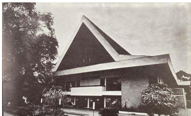
Gambar 3.6 Teater Tertutup

Terdapat pula Teater Tertutup, yaitu ruangan yang tepat berada di balik Teater Terbuka. Teater Tertutup hanya dapat menampung kurang lebih 400 orang penonton. Di Teater Tertutup ini pernah diselenggarakan antara lain pertunjukan tari kontemporer oleh Huriyah Adam, Sardono W. Kusumo, Farida Syuman, dan lainnya. Teater Tertutup juga dipergunakan untuk pertemuan dan diskusi, seperti diskusi besar tentang Angkatan '66 dalam sastra Indonesia pada tahun 1969 dan Pertemuan Sastrawan Indonesia pada tahun 1972. 61