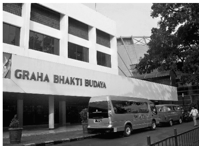
Gambar 3.11 Graha Bhakti Budaya