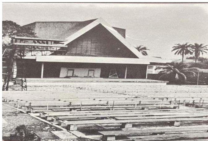
Gambar 3.5 Teater Terbuka

Terdapat pula Teater Terbuka yang dapat menampung hingga 3.000 orang penonton, duduk di atas bangku kayu di bawah langit terbuka. Di panggung yang luas ini pernah dipentaskan berbagai pertunjukan yang diperkirakan mendapat perhatian masyarakat secara luas, seperti gambang kromong dan lenong (bentuk kesenian Betawi), ketoprak dan ludruk (bentuk kesenian Jawa), srimulat (dari Surabaya), gending karesemen (dari Sunda), tarling (dari Cirebon), randai (dari Minangkabau), dan berbagai kesenian rakyat daerah lainnya seperti dari Kalimantan, Sulawesi, Aceh, dan lainnya. Di sini juga pernah dipentaskan berbagai jenis kesenian asing seperti ballet (dari Perancis, Jerman, Belanda), konser musik dan ballet (dari Amerika, Australia, Perancis, dan Jerman). Dan pementasan teater kontemporer yang diselenggarakan oleh Bengkel Teater seperti Kasidah Barjanzi. 60