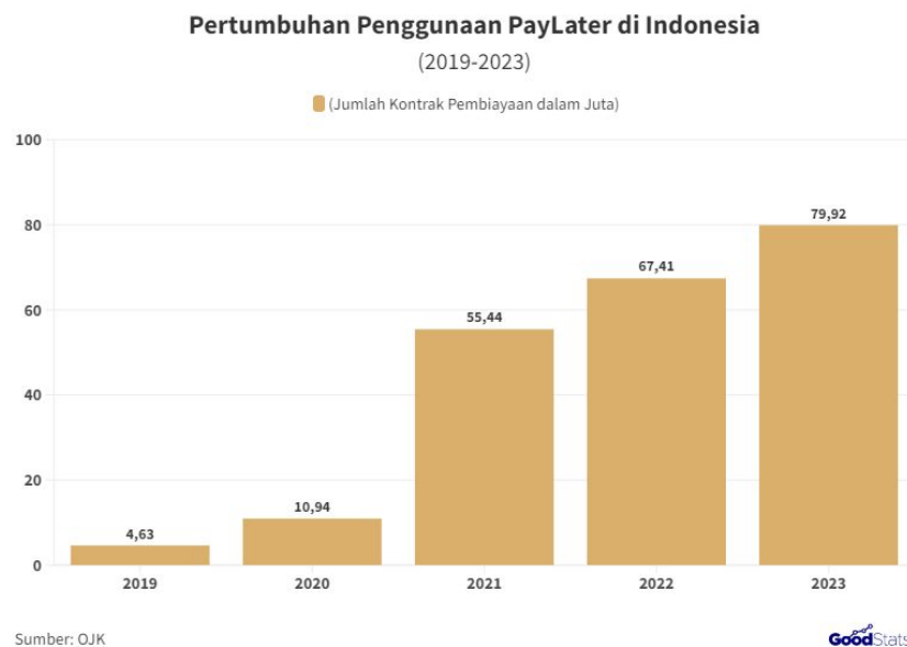
Gambar 1. 1 Pertumbuhan Pengguna PayLater di Indonesia (2019-2023)

Perkembangan teknologi digital telah mendorong transformasi sistem keuangan menuju era cashless society . Perubahan ini tidak hanya meningkatkan efisiensi transaksi, tetapi juga membentuk pola konsumsi yang lebih instan, khususnya pada generasi muda. Pada era pasca Covid-19, pergeseran perilaku konsumsi ke arah penggunaan layanan keuangan digital semakin menguat, termasuk melalui layanan Buy Now Pay Later (BNPL). BNPL sebagai inovasi fintech lending memungkinkan konsumen melakukan pembelian secara instan dengan pembayaran ditunda. Kemudahan ini secara empiris terbukti meningkatkan penggunaannya di Indonesia. Data (Otoritas Jasa Keuangan, 2022) dalam (GoodStats, 2023), menunjukkan peningkatan kontrak PayLater dari 4,63 juta pada tahun 2019 menjadi 79,92 juta pada tahun 2023. Peningkatan ini mengindikasikan bahwa BNPL tidak hanya menjadi konsumtif berbasis utang.