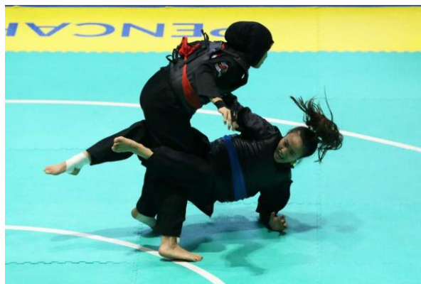
Gambar 2.4 Teknik Kunci/Jatuhan

Kuncian adalah teknik lanjutan yang bertujuan untuk mengunci atau mengontrol sendi lawan agar tidak dapat bergerak. Kunci sering digunakan dalam situasi pertarungan jarak dekat. Teknik ini membutuhkan pemahaman mendalam tentang anatomi dan biomekanika tubuh manusia.