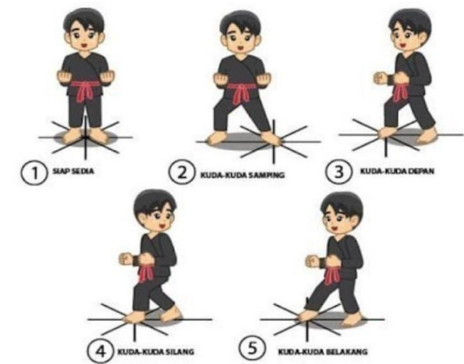
Gambar 2.1 Teknik Kuda-kuda