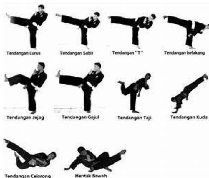
Gambar 2.3 Teknik Tendangan

Tendangan adalah teknik serangan menggunakan kaki, yang biasanya memiliki jangkauan lebih jauh dan kekuatan lebih besar daripada pukulan. Macam-macam tendangan meliputi tendangan lurus, sabit, T, dan belakang. Setiap tendangan memiliki target dan fungsi yang berbeda. (Lubis, Johansyah & Wardoyo, 2016, p. 125).