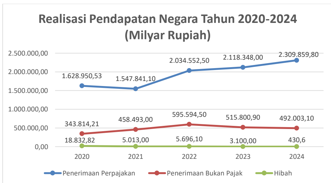
Gambar 1.1 Realisasi Pendapatan Negara Tahun 2020-2024