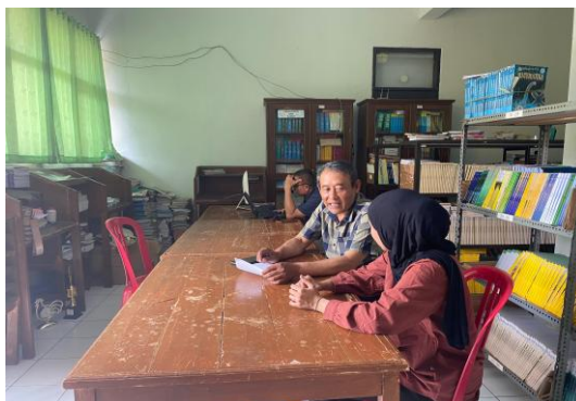
Gambar 3.1 Obsevasi SMA Negeri 1 Jatiwaras