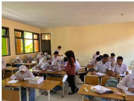
Gambar 3.2 Instrumen di Kelas XII-1 SMA Negeri 1 Jatiwaras