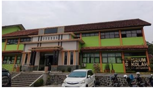
Gambar 3.9 Lokasi Penelitian SMA Negeri 1 Jatiwaras