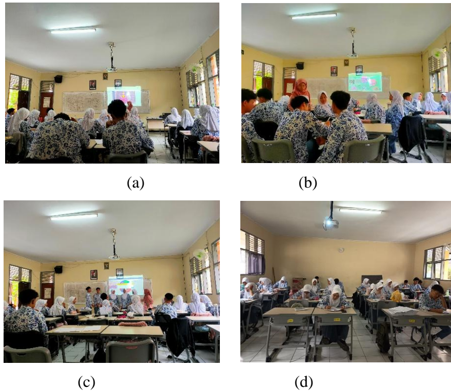
Gambar 3.3 Pertemuan Kedua Kelas Eksperimen: (a) Stimulasi Peserta Didik; (b) Pengisian LKPD; (c) Presentasi Hasil Diskusi; (d) Pengisian Angket Metakognitif.