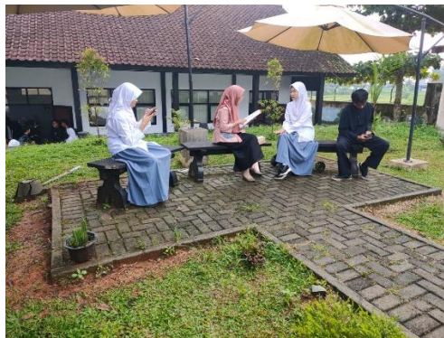
Gambar 3.7 Wawancara Peserta Didik Kelas Kontrol Sumber: Dokumen Pribadi