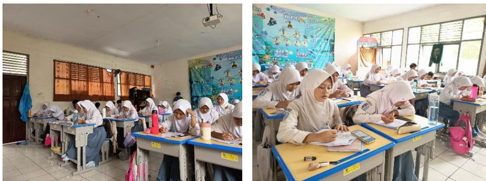
Gambar 3.1 Pelaksanaan Uji Coba Instrumen