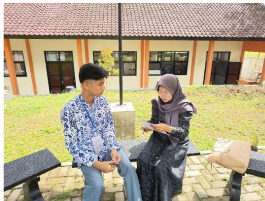
Gambar 3.4 Wawancara Peserta Didik Kelas Eksperimen