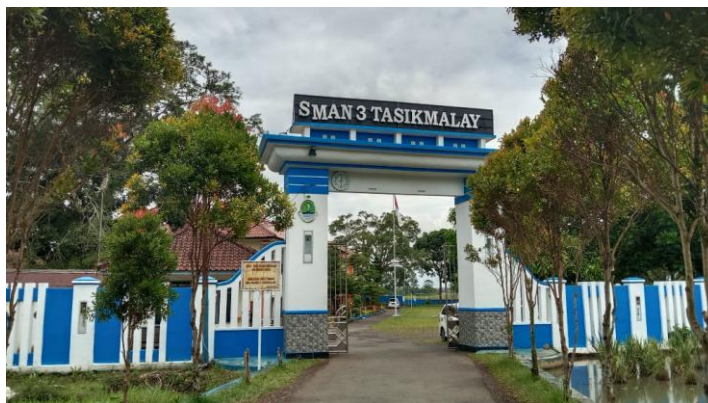
Gambar 3.8 SMA Negeri 3 Kota Tasikmalaya

Penelitian ini dilaksanakan di SMAN 3 Tasikmalaya yang terletak di Jl. Kolonel Basyir Surya No. 89, Sukanagara, Kec. Purbaratu, Kota Tasikmalaya, 46196.