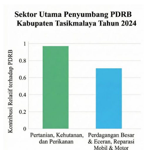
Gambar 1.1 Grafik Utama Penyumbang PDRB 2024

Hal yang sama terjadi pada masyarakat Dusun Ciranji, Desa Cibatuireng, yang mana di Dusun Ciranji terlihat suatu fenomena yang menarik untuk dikaji. Secara ekonomi beberapa keluarga di Dusun ini telah menunjukkan kemampuan yang memadai, ditandai dengan kepemilikan usaha seperti berwiraswasta, kendaraan bermotor, serta kemampuan memenuhi kebutuhan primer.