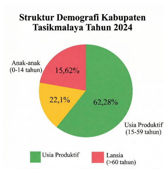
Gambar 1.2 Struktur Demografi Kabupaten Tasikmalaya

Capaian ditingkat dusun ini tidak terlepas dari kondisi struktur perekonomian Kabupaten Tasikmalaya yang lebih luas sebagai wilayah induknya. Sektor pertanian, kehutanan, dan perikanan menjadi penggerak utama perekonomian di Kabupaten Tasikmalaya pada tahun 2024, disusul oleh sektor perdagangan besar dan eceran, reparasi mobil dan sepeda motor. sektor tersebut menjadi penyumbang PDRB (Produk Domestik Regional Bruto) terbesar di kabupaten ini, Badan Pusat Statistik Kabupaten Tasikmalaya (2024).