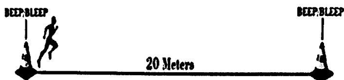
Gambar 3. 1 Multistage Fitness Test