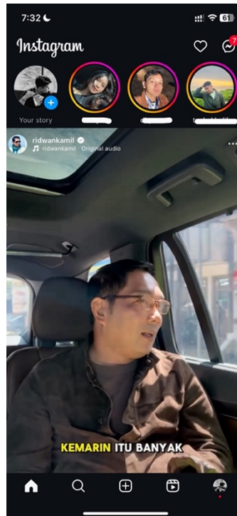
Gambar 4. 2 Tampilan Masuk Instagram

Gambar 4.2 di atas menunjukkan tampilan beranda atau home Instagram yang muncul saat pengguna pertama kali membuka aplikasi. Beranda ini menampilkan unggahan terbaru serta cerita dari akun-akun yang diikuti oleh pengguna, sehingga berfungsi sebagai sumber informasi terkini yang relevan. Selain beranda, terdapat juga menu Explore di sampingnya, yang dirancang untuk membantu pengguna menemukan konten baru yang mungkin menarik, berdasarkan interaksi dan preferensi mereka sebelumnya. Melalui kedua menu ini, pengguna dapat dengan mudah mengakses dan menikmati berbagai konten yang dihasilkan oleh komunitas Instagram.