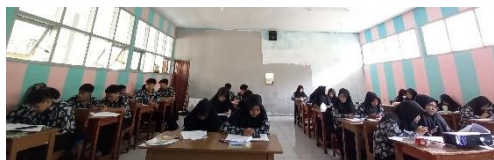
Gambar 3. 15 Pelaksanaan Posttest Dikelas Kontrol X MIPA 3