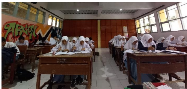
Gambar 3.2 Pelaksanaan Uji Coba Instrumen