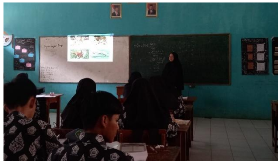
Gambar 3. 11 Model Pembelajaran Discovery Learning