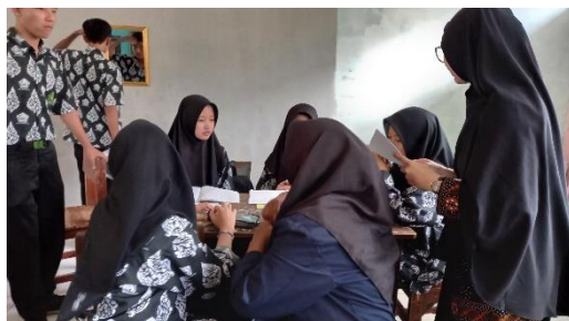
Gambar 3. 12 peserta didik mengajukan pertanyaan mengenai materi yang berkaitan, guru meminta peserta didik untuk berdiskusi secara berkelompok dan mengerjakan LKPD

hasil diskusi kelompok di depan kelas dan melakukan tanya jawab terhadap kegiatan presentasi (Gambar 3.13).