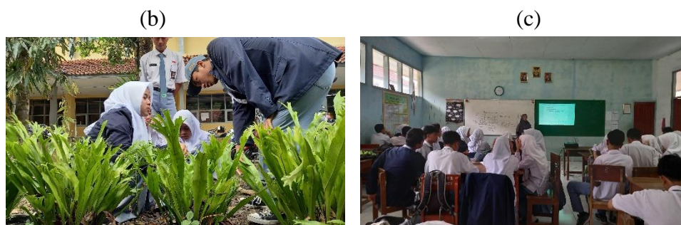
Gambar 3. 5 (a) selanjutnya guru menjelaskan tentang kerangka proyek yang harus dibuat oleh peserta didik dimulai dengan pertanyaan esensial untuk menjawab proyek yang akan dibuat. (b) peserta didik membuat kelompok dan mengerjakan LKPD serta melakukan jelajah alam sekitar untuk mengamati keanekaragaman hayati (c) guru model menjelaskan aturan tugas dan waktu pengumpulan