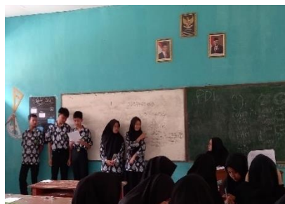
Gambar 3. 8 Peserta Didik Mempresentasikan Hasil Diskusi Kelompok Di Depan Kelas Dan Melakukan Tanya Jawab Terhadap Kegiatan Presentasi