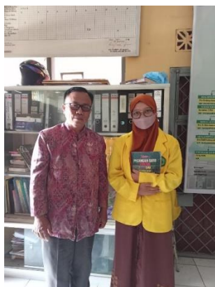
Gambar 3. 1 Konsultasi dengan Guru Biologi Kelas X