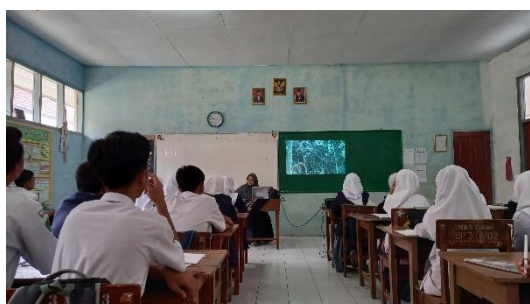
Gambar 3. 4 guru model memberikan stimulus kepada peserta didik dengan cara menyajikan video materi keanekaragaman hayati

Setelah itu dilanjutkan dengan sintaks pembelajaran PJBL pendekatan jelajah alam sekitar . pembelajaran di awali dengan guru model memberikan stimulus kepada peserta didik dengan cara menyajikan video materi keanekaragaman hayati (Gambar 3.4) a) selanjutnya guru menjelaskan tentang kerangka proyek yang harus dibuat oleh peserta didik dimulai dengan pertanyaan esensial untuk menjawab proyek yang akan dibuat. b) peserta didik membuat kelompok dan mengerjakan LKPD serta melakukan jelajah alam sekitar untuk mengamati keanekaragaman hayati c) guru model menjelaskan aturan tugas dan waktu pengumpulan (Gambar 3.5).