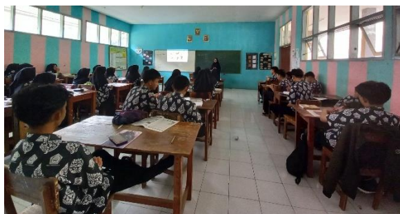
Gambar 3. 6 Model Pembelajaran Discovery Learning