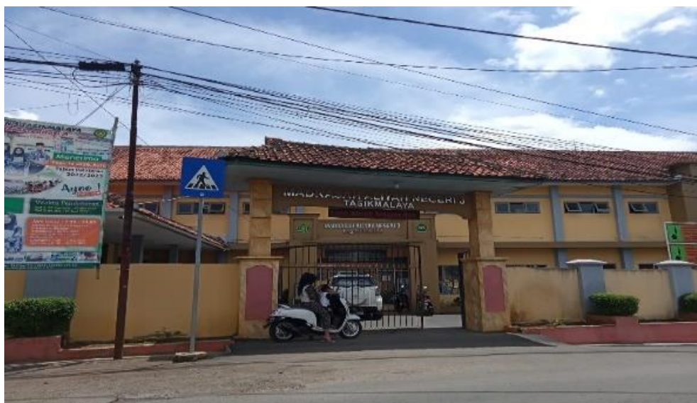
Gambar 3. 16 Lokasi Penelitian

Penelitian dilaksanakan di MAN 3 Tasikmalaya yang beralamat di Jl. Raya Panumbangan No.33, Pakemitan, Kec. Ciawi, Komplek Pesantren Mathlaul Kab. Tasikmalaya, Jawa Barat 46156. Gambaran lokasi penelitian dapat dilihat pada Gambar 3.16.