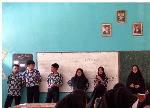
Gambar 3. 13 guru meminta peserta didik mempresentasikan hasil diskusi kelompok di depan kelas dan melakukan tanya jawab terhadap kegiatan presentasi