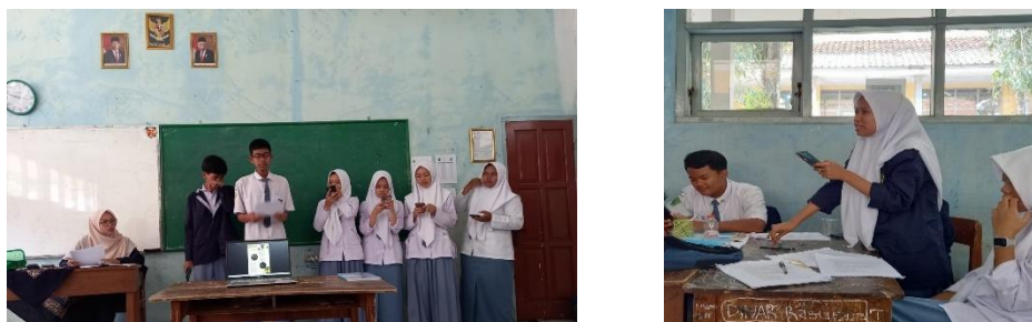
Gambar 3. 10 Semua kelompok mempresentasikan mengenai proyek poster dalam upaya tindakan preventif pelestarian keanekaragaman hayati sebagai

Dikelas saat proses pembelajaran pertemuan ke dua, guru mempersilahkan semua kelompok mempresentasikan mengenai proyek poster dalam upaya pelestarian keanekaragaman hayati sebagai hasil proyek. Selanjutnya guru memberikan refleksi terhadap aktifitas dan hasil proyek peserta didik (Gambar 3.10)