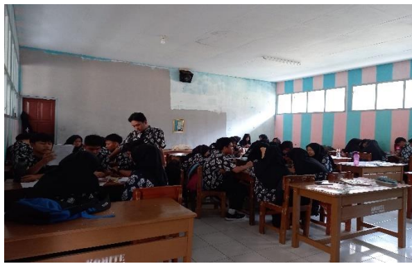
Gambar 3. 7 Peserta Didik Untuk Berdiskusi Secara Berkelompok Dan Mengerjakan LKPD

Setelah peserta didik mengajukan pertanyaan mengenai materi yang berkaitan, guru meminta peserta didik untuk berdiskusi secara berkelompok dan mengerjakan LKPD dengan melakukan pengamatan melalui youtube (Gambar 3.7) selanjutnya guru meminta peserta didik mempresentasikan hasil diskusi kelompok di depan kelas dan melakukan tanya jawab terhadap kegiatan presentasi (Gambar 3.8).