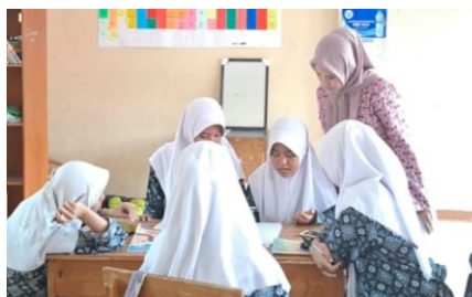
Gambar 3.6 Kegiatan Inti (Tahapan Monitoring)

Peneliti melakukan monitoring dengan meminta kelompok yang sudah siap dengan rencana proyek yang akan dibuat, dimana dalam proses pengerjaannya peneliti akan mendekati setiap kelompok untuk menjembatani hasil informasi yang didapat dengan proyek yang akan dibuat. Setelah dilaksanakannya konsultasi dari kelompok dengan peneliti, peneliti menyetujui rencana kelompok apabila telah sesuai harapan.