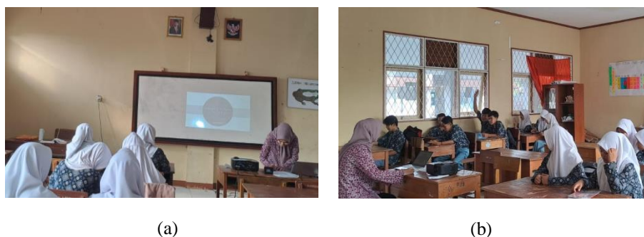
Gambar 3.2 Kegiatan Pendahuluan pada proses pembelajaran (a) Kegiatan berdo'a, (b) presensi peserta didik

Peneliti mengucapkan salam sebelum memulai pembelajaran, memperkenalkan diri dan menanyakan kabar siswa yang hadir di kelas, kemudian peneliti menunjuk ketua kelas untuk memimpin do'a dan seluruh peserta didik berdo'a terlebih dahulu, setelah itu peneliti menanyakan dan mengabsen peserta didik.