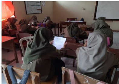
Gambar 3.10 Posttest

didik kembali duduk diposisi semula untuk melaksanakan posttest dengan mengerjakan soal posttest yang telah dibagikan.