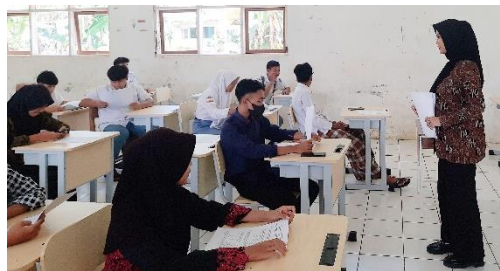
Gambar 3.1 Uji Coba Instrumen