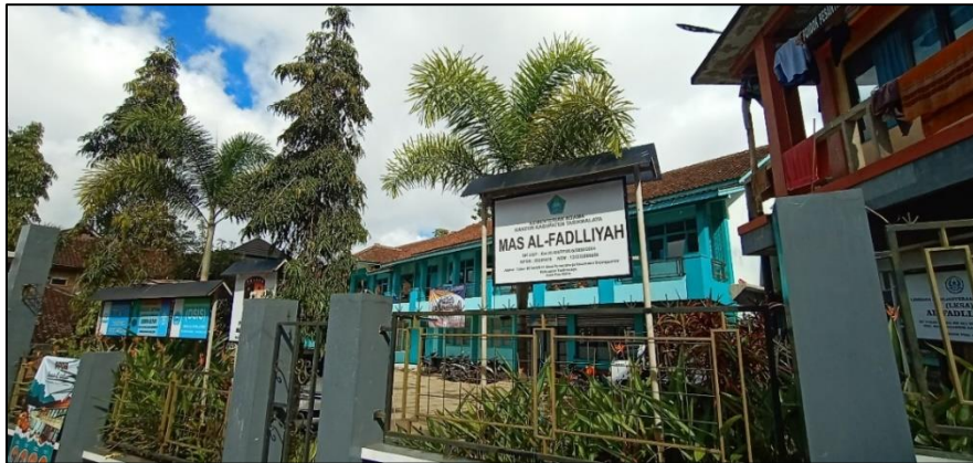
Gambar 3.4 Lokasi Penelitian MA Al-Fadllyyah Bojongsambir

Penelitian ini dilaksanakan di kelas X MIPA MA Al-Fadllyyah Bojongsambir. Gambar 3.4 di bawah menunjukkan sekolah tempat dimana dilaksanakannya penelitian yang berlokasi di Kp. Tuban Desa Purwaraharja RT/RW 005/001 Kecamatan Bojongsambir.