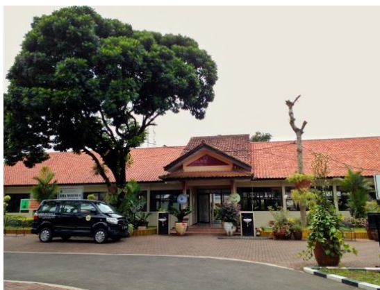
Gambar 3.9 Lokasi Penelitian (SMA Negeri 6 Tasikmalaya)

Penelitian ini dilaksanakan di kelas XI IPA SMA Negeri 6 Tasikmalaya tahun ajaran 2022/2023 yang berada di Jalan Cibungkul, Kelurahan Sukamajukaler, Kecamatan Indihiang, Kota Tasikmalaya, kode pos 46151. Tempat penelitian dapat dilihat pada gambar berikut.