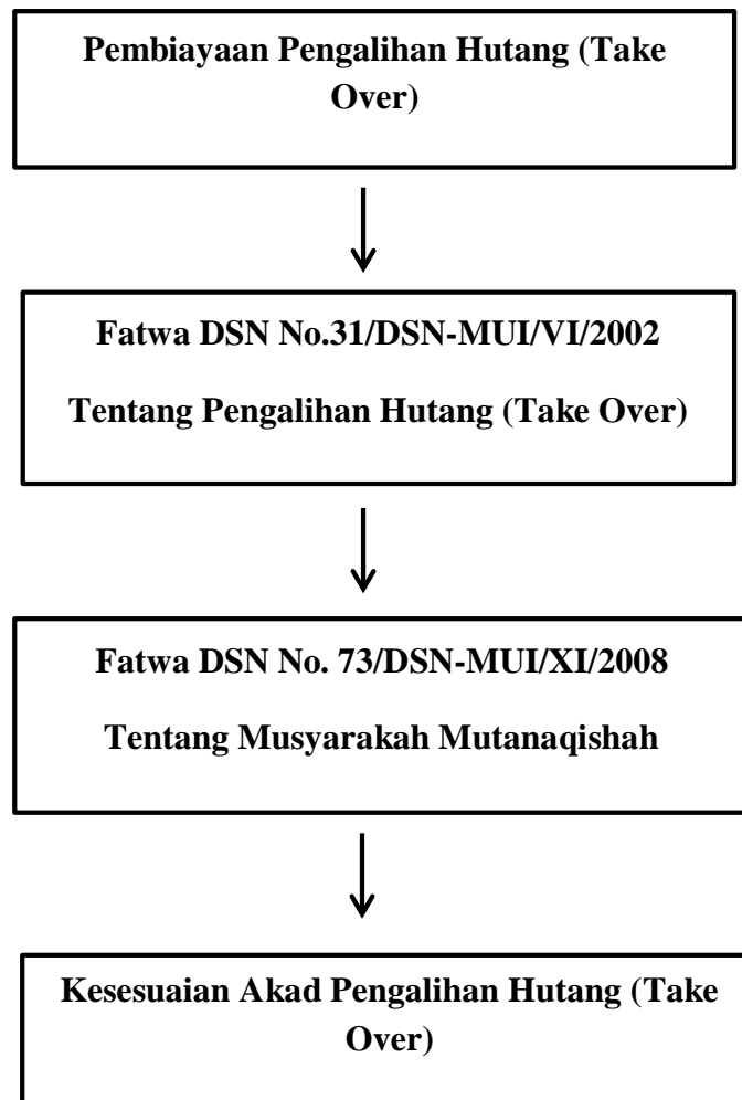
Gambar 1.3 Kerangka Pemikiran