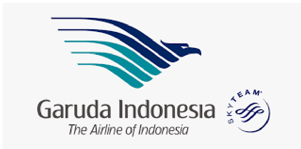
Gambar 3.1. 2022 Logo PT. Garuda Indonesia, Tbk.