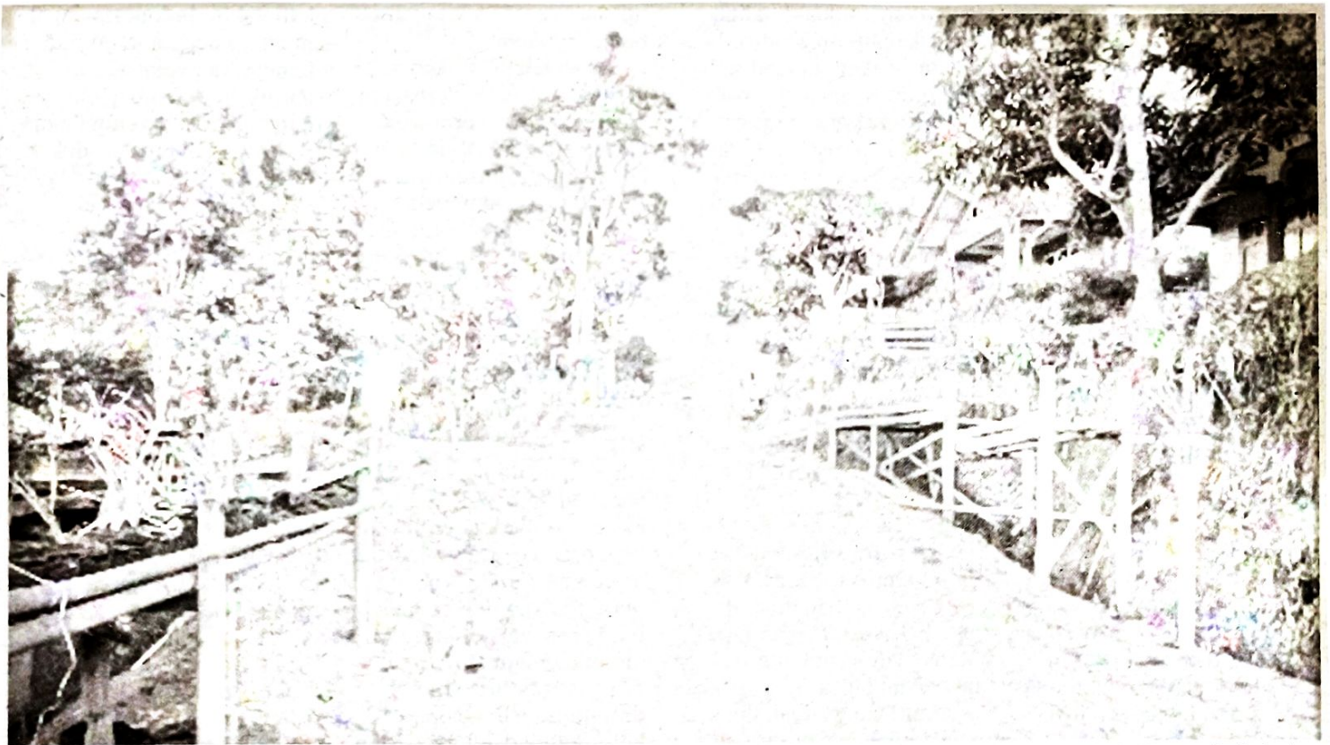
Penerapan konsep KRPL dalam program ecovillage hingga ke pemanfaatan lahan sisi jalan yang menarik.