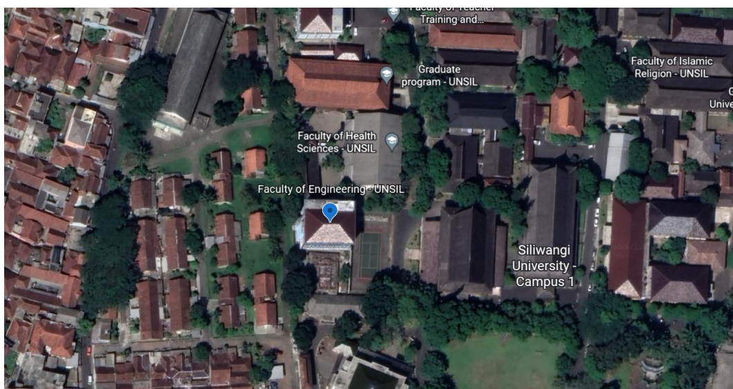
Gambar 3. 6 Lokasi Gedung Fakultas Teknik Universitas Siliwangi

Denah lokasi penelitian dapat dilihat pada Gambar 2.6 Lokasi Gedung Fakultas Teknik Universitas Siliwangi ( Google Earth, 2022 ) :