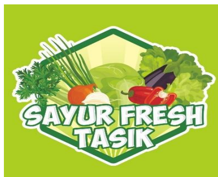
Gambar 5. Logo Sayur Fresh Tasik

Akun @sayurfreshtasik merupakan Akun Instagram resmi ( Official Account ) milik Sayur Fresh Tasik. Pihak penjual dengan konsumen yang mengikuti dan yang tidak mengikuti akun tersebut dapat melakukan interaksi secara langsung di dalam account ini. Akun Instagram @sayurfreshtasik menginformasikan berbagai macam penawaran produk terbaru yang diunggah untuk para followers @sayurfreshtasik melalui foto dan konten yang nantinya diharapkan dapat memikat minat beli konsumen.