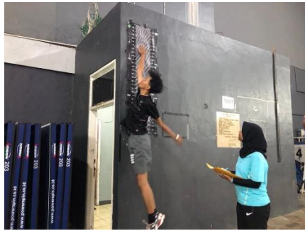
Gambar 3.2. vertical jump