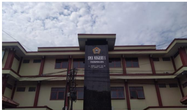
Gambar 3.4 Lokasi Penelitian SMA Negeri 1 Tasikmalaya