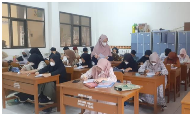
Gambar 3.2 Pelaksanaan Uji Coba Instrumen di Kelas XII MIPA 2 SMAN 1 Tasikmalaya