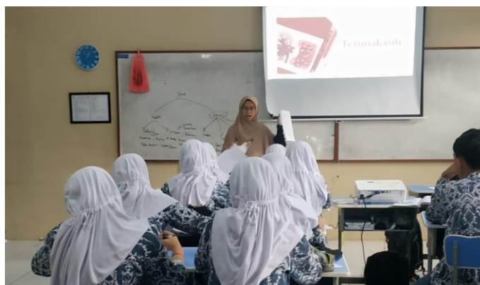
Gambar 3.3 Pengambilan Data Instrumen Penelitian di Kelas XI MIPA 1 SMAN 1 Tasikmalaya