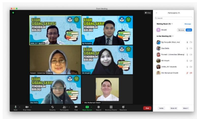
Gambar 3.5 Pelaksanaan Sidang Skripsi