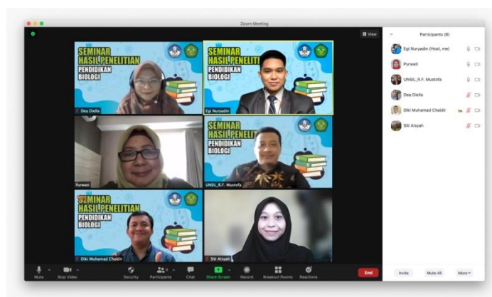
Gambar 3.4 Pelaksanaan Sidang Seminar Hasil