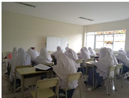
Gambar 3.3 Penyebaran Instrumen Penelitian di Kelas X MIA