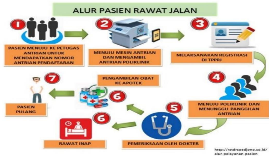
Gambar 2.1 Alur Pasien Rawat Jalan

(Sumber: Buku panduan Manajemen Informasi Kesehatan II, Kementerian Kesehatan 2017)