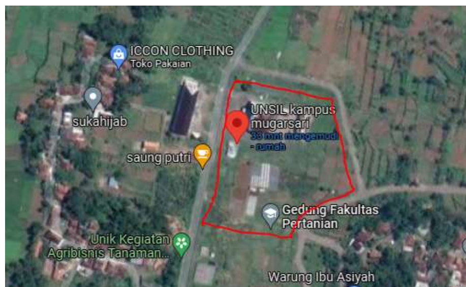
Gambar 3.1 Lokasi Penelitian

Penelitian dilakukan di Proyek Pembangunan Gedung Rektorat Kampus II Universitas Siliwangi. Sebagai gambaran, lokasi proyek disajikan dalam bentuk peta situasi dapat dilihat pada Gambar 3.1 berikut ini.