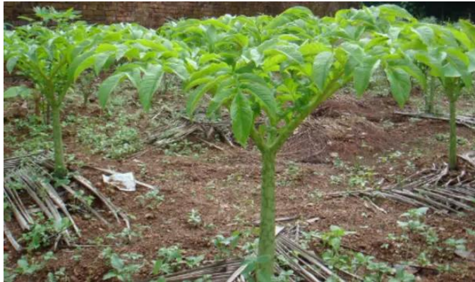
Gambar 2.1 Tanaman Porang

Untuk lebih rincinya, menurut Sumarwoto (2005) dan Perhutani (2013) morfologi tanaman porang terdiri dari batang, daun, bubil atau katak, umbi, bunga, buah atau biji dan akar, dapat diuraikan pada paragraf berikut.