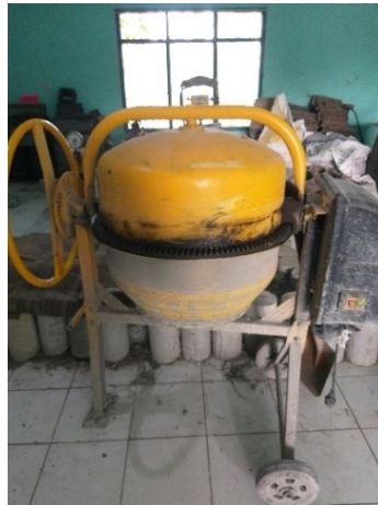
Gambar 3.7 Concrete Mixer