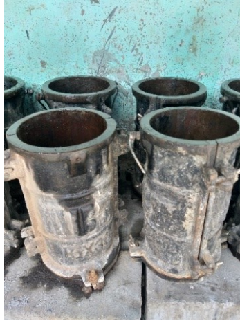
Gambar 3.9 Cetakan Benda Uji