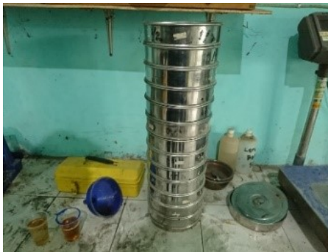
Gambar 3.16 Saringan