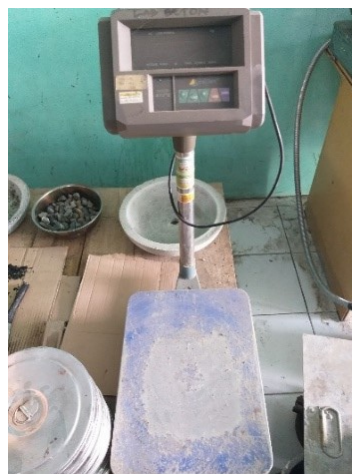
Gambar 3.8 Timbangan Digital