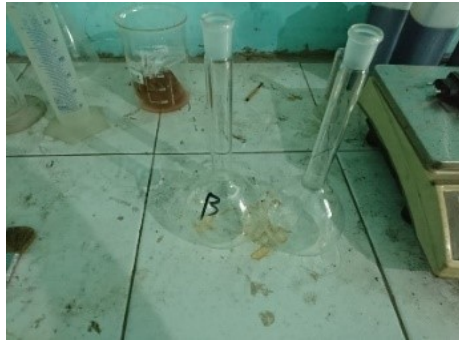
Gambar 3.12 Piknometer