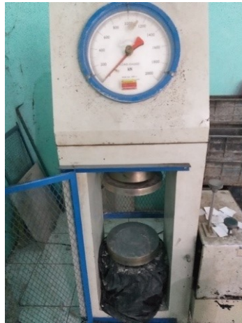
Gambar 3.10 Mesin Kuat Tekan