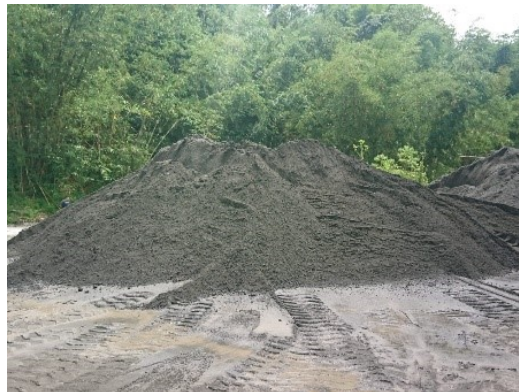
Gambar 3.20 Agregat Halus

Agregat halus yang digunakan adalah pasir dari Gunung Galunggung yang lolos saringan no. 4 dan tertahan no. 200.