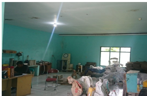
Gambar 3.3 Ruang Laboratorium PT. Trie Mukty Pertama Putra