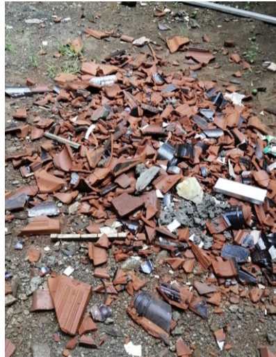
Gambar 3.21 Pecahan Genteng