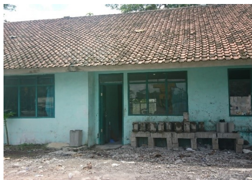
Gambar 3.2 Laboratorium PT. Trie Mukty Pertama Putra