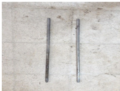
Gambar 3.17 Tramping Rod