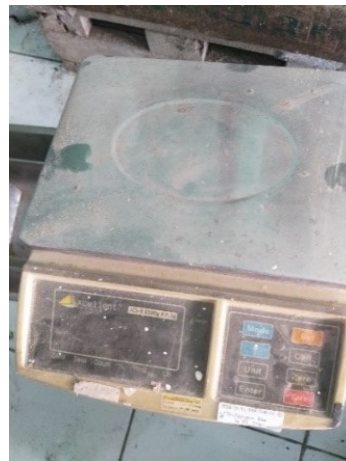
Gambar 3.5 Timbangan Digital