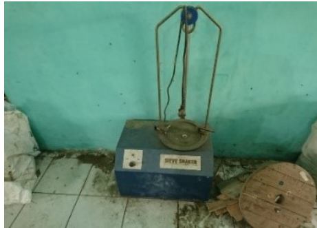
Gambar 3.15 Shive Shaker