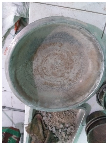
Gambar 3.4 Cawan

Alat-alat yang digunakan dalam penelitian ini adalah sebagai berikut: