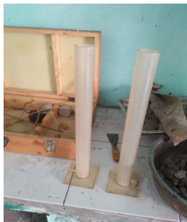
Gambar 3.11 Gelas Ukur