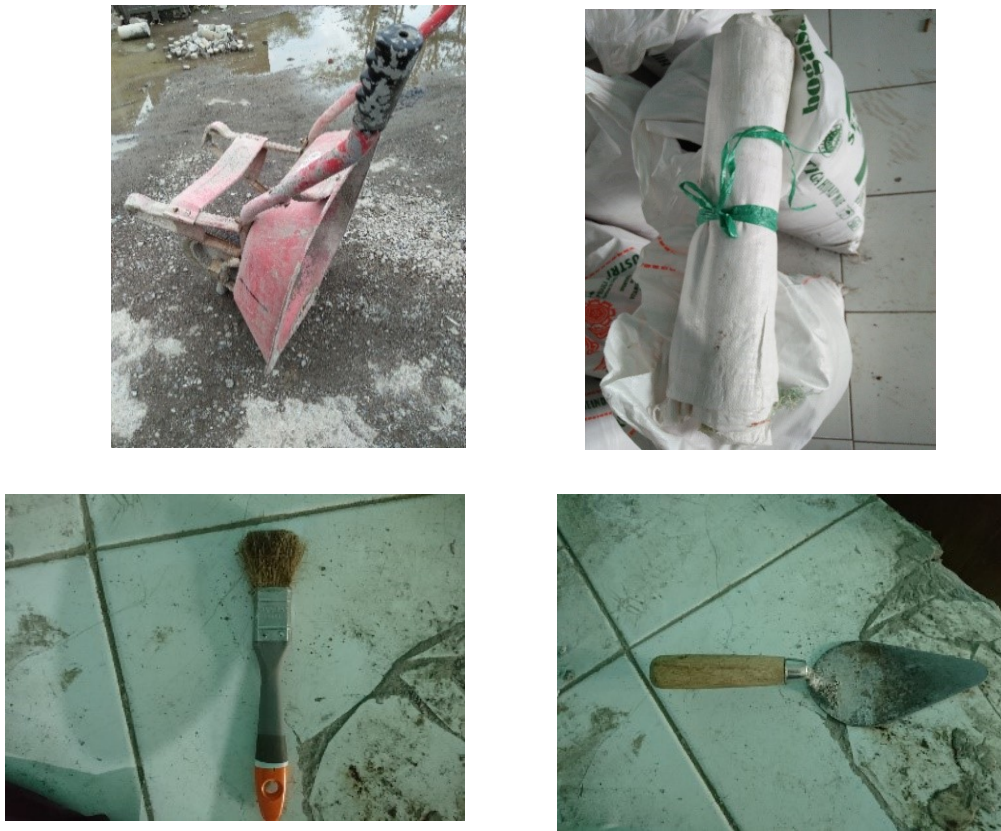
Gambar 3.18 Alat Pendukung Lainnya