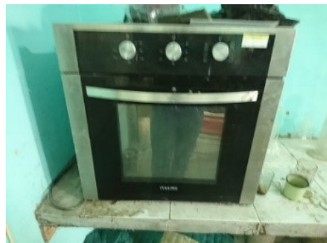
Gambar 3.13 Oven