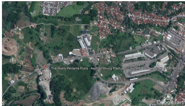
Gambar 3.1 Map Lokasi Penelitian

Kegiatan dalam penelitian ini dilakukan melalui beberapa tahap, diawali dengan studi pustaka, penyiapan bahan, pengujian bahan, pembuatan benda uji, dan dilanjutkan dengan pengujian kuat tekan benda uji yang dilakukan di Laboratorium PT. Trie Mukty Pertama Putra – Asphalt Mixing Plant and Concrete Batching Plant (AMP & CBP) yang berlokasi di Jalan Raya Mangkubumi-Indihiang (Mangin), Bungursari, Kec. Indihiang, Kota Tasikmalaya. Penelitian ini dimulai pada tanggal 9 Februari 2021.