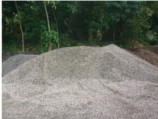
Gambar 3.19 Agregat Kasar