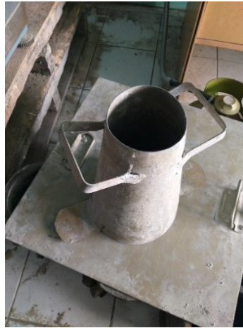
Gambar 3.6 Krucut Abrams