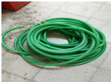
Gambar 3.14 Selang