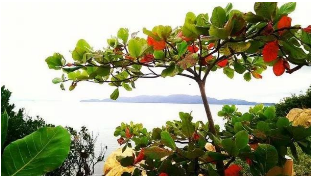
Gambar 1. Pohon ketapang

Tanaman ketapang merupakan tanaman yang termasuk ke dalam famili combretaceae yang tumbuh di daerah tropis dan subtropis, berasal dari India kemudian menyebar ke daerah Asia Tenggara dan Australia. Pohon ketapang bisa ditemukan di daerah pesisir pantai dan digunakan sebagai tanaman peneduh atau tanaman hias di sepanjang jalan atau halaman.