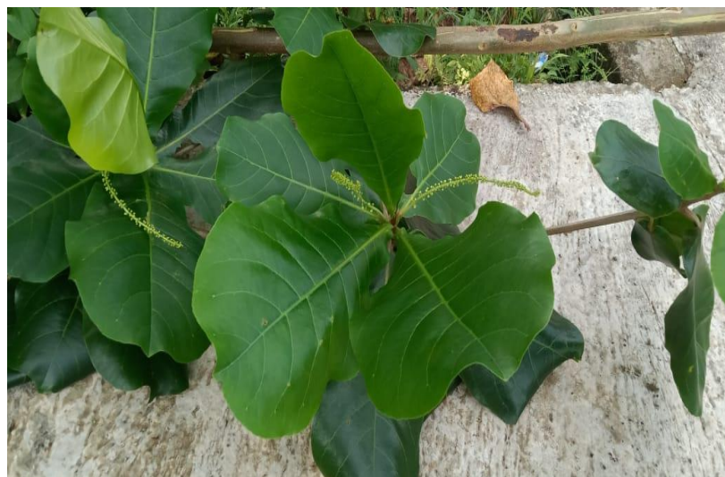
Gambar 2. Daun ketapang (Sumber : Dokumentasi pribadi)

Menurut Fahmy, Alsayed dan Singab (2015), terungkap bahwa genus Terminalia kaya akan sumber tannin, pseudotannin, termasuk asam galat dan ester galat sederhana, asam chebulic, ellagitannin nochebulic, turunan asam ellagic dan glikosida asam ellagic, asam fenolat, flavonoid triterpen dan glikosida triterpenoid. Selanjutnya dijelaskan oleh Baratelli et al. (2012) kandungan alelokimia dari suatu tanaman merupakan salah satu mekanisme melindungi tanaman yang menghasilkan alelopati dari mikroorganisme, virus, serangga dan patogen atau predator lain, atau bahkan menghambat pertumbuhan tanaman disekitarnya atau merangsang pertumbuhan benih.