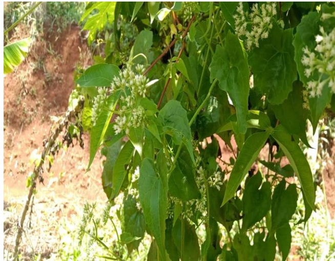
Gambar 5. Gulma sembung rambat

Sembung rambat merupakan tumbuhan yang dimasukkan ke dalam gulma berdaun lebar yang dapat menginvasi areal pertanian dengan cepat. Sembung rambat memiliki kemampuan untuk melakukan proses pertumbuhan dari fase vegetative sampai fase berbunga dengan cepat dan memiliki kemampuan dalam menghasilkan alelopati. Sembung rambat sebagai gulma mampu memanjat vegetasi lain, menutupi tajuk pohon, menghalangi sinar matahari dan mengganggu proses fotosintesis (Vijay, 2015). Sembung rambat termasuk ke dalam family Asteraceae dengan taksonomi sebagai berikut :