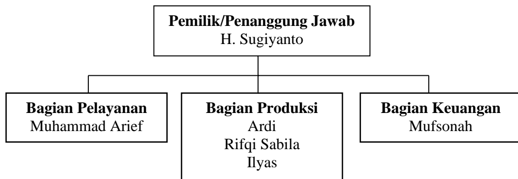
Gambar 3.1 Struktur Organisasi Perusahaan

Berdasarkan informasi dari pemilik, berikut struktur organisasi perusahaan Pabrik Mie Gajah Mungkur :