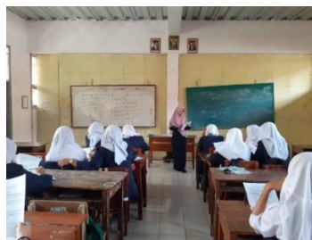
Gambar 3.13 Proses Uji Instrumen di Kelas XI MIPA 3