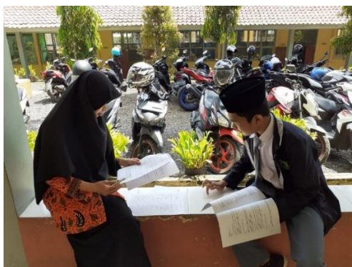
Gambar 3.25 Proses Wawancara Semi Terstruktur dengan Subjek kelas XI MIPA 3