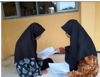
Gambar 3.26 Proses Wawancara Semi Terstruktur dengan Subjek kelas XI MIPA 2