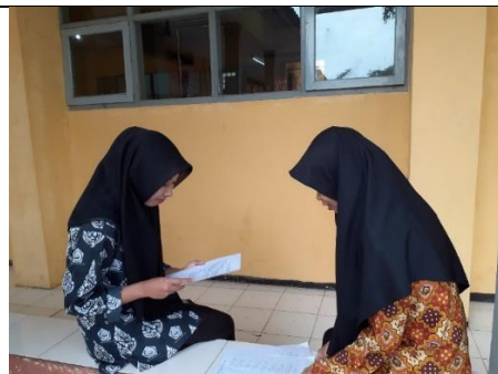
Gambar 3.27 Proses Wawancara Semi Terstruktur dengan Subjek kelas XI MIPA 2