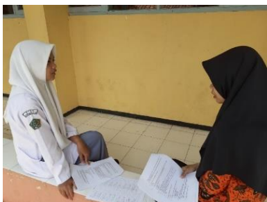
Gambar 3.23 Proses Wawancara Semi Terstruktur dengan Subjek kelas XI MIPA 3