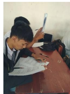
Gambar 3.19 Proses Uji Instrumen di Kelas XI MIPA 3