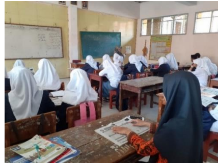
Gambar 3.5 Kegiatan Observasi Pembelajaran Sistem Regulasi kelas XI MIPA 3