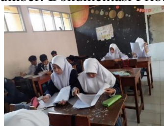
Gambar 3.15 Proses Uji Instrumen di Kelas XI MIPA 3