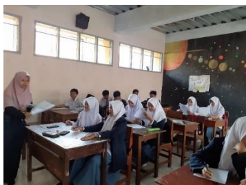
Gambar 3.12 Proses Uji Instrumen di Kelas XI MIPA 3