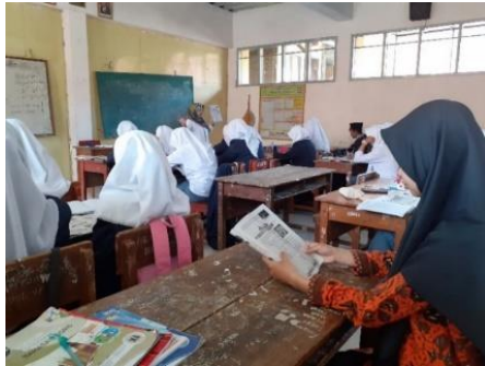
Gambar 3.4 Kegiatan Observasi Pembelajaran Sistem Regulasi kelas XI MIPA 3