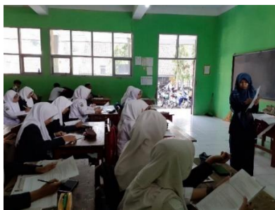
Gambar 3.9 Proses Uji Coba Instrumen di Kelas XI MIPA 5