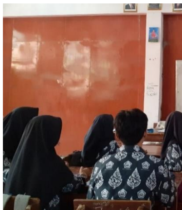
Gambar 3.7 Kegiatan Observasi Pembelajaran Sistem Regulasi kelas XI MIPA 2