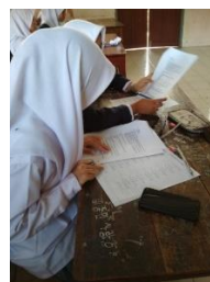
Gambar 3.17 Proses Uji Instrumen di Kelas XI MIPA 3