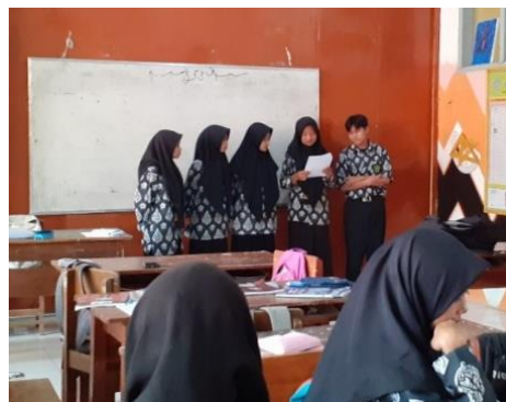
Gambar 3.8 Kegiatan Observasi Pembelajaran Sistem Regulasi kelas XI MIPA 2