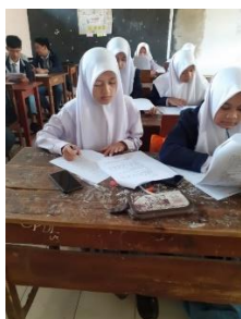
Gambar 3.16 Proses Uji Instrumen di Kelas XI MIPA 3