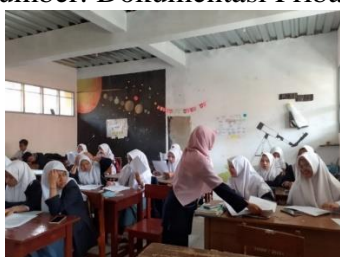
Gambar 3.14 Proses Uji Instrumen di Kelas XI MIPA 3