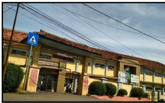
Gambar 3.1 Sekolah MAN 3 Kabupaten Tasikmalaya

Penelitian ini dilakukan di MAN 3 Tasikmalaya pada kelas XI MIPA 2 dan XI MIPA 3 Tahun Ajaran 2021/2022.