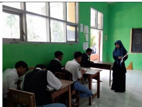
Gambar 3.10 Proses Uji Coba Instrumen di Kelas XI MIPA 5