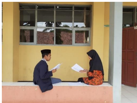
Gambar 3.24 Proses Wawancara Semi Terstruktur dengan Subjek kelas XI MIPA 3