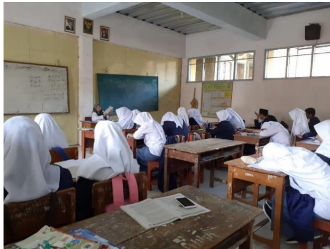
Gambar 3.6 Kegiatan Observasi Pembelajaran Sistem Regulasi kelas XI MIPA 3