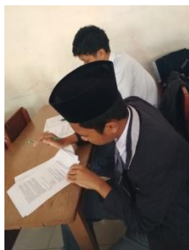
Gambar 3.18 Proses Uji Instrumen di Kelas XI MIPA 3