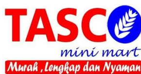
Gambar 3. 1 Logo Perusahaan

Sistem pelayanan ini masih terus di kembangkan dan terus dilakukan perbaikan yang bertujuan untuk memberikan hasil yang maksimal untuk perusahaan sehingga tujuan perusahaan dapat tercapai.