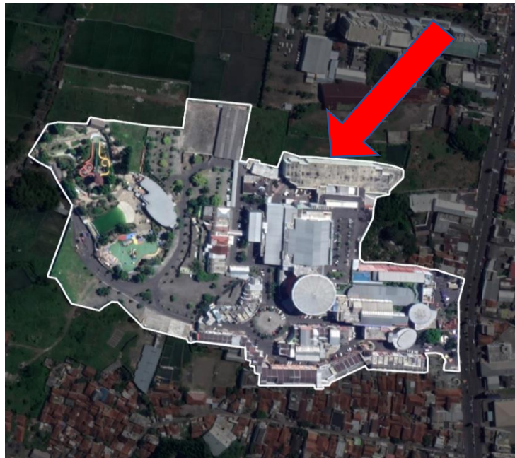
Gambar 3.1 Lokasi Penelitian

Lokasi penelitian ini dilaksanakan di areal parkir Asia Plaza yang berlokasi di Jl. KHZ Mustofa, Kecamatan Cipedes, Kota Tasikmalaya.