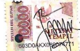
Della Intan Cahyati