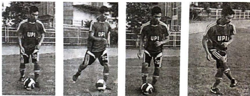
Gambar 2.1 Menendang Dengan Kaki Bagian Dalam