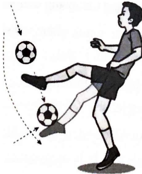
Gambar 2.5. Menghentikan Bola Dengan Punggung Kaki