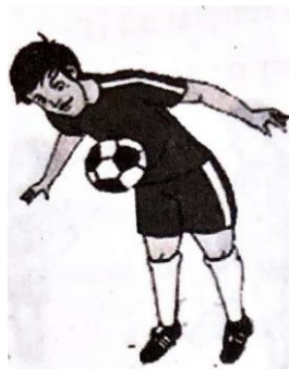
Gambar 2.8. Menghentikan bola dengan perut