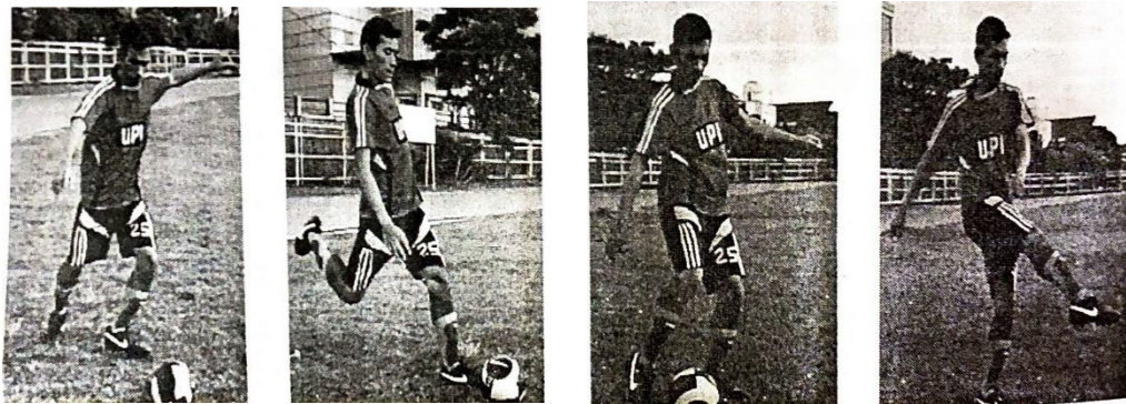
Gambar 2.3. Menendang Dengan Punggung Kaki