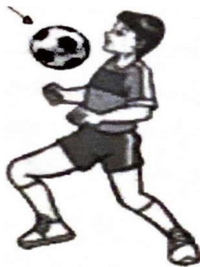
Gambar 2.6. Menghentikan Bola Dengan Dada