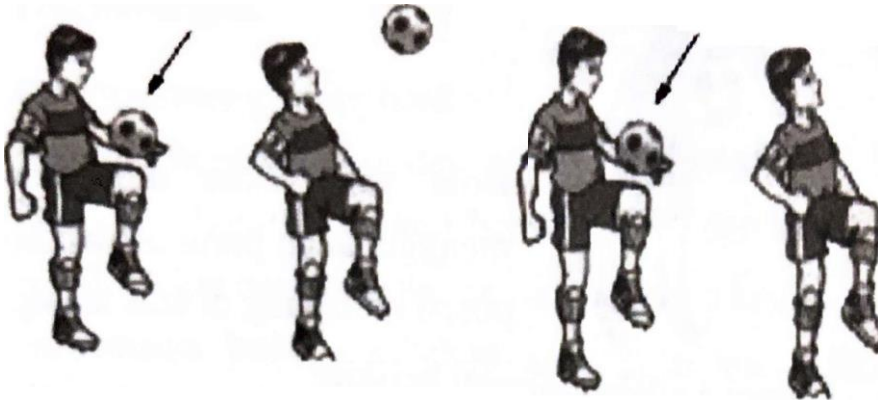
Gambar 2.7. Menghentikan Bola Dengan Paha