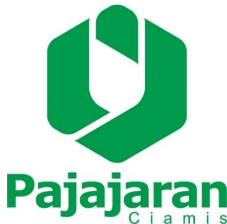
Gambar 3.1 Logo Pajajaran Toserba Ciamis