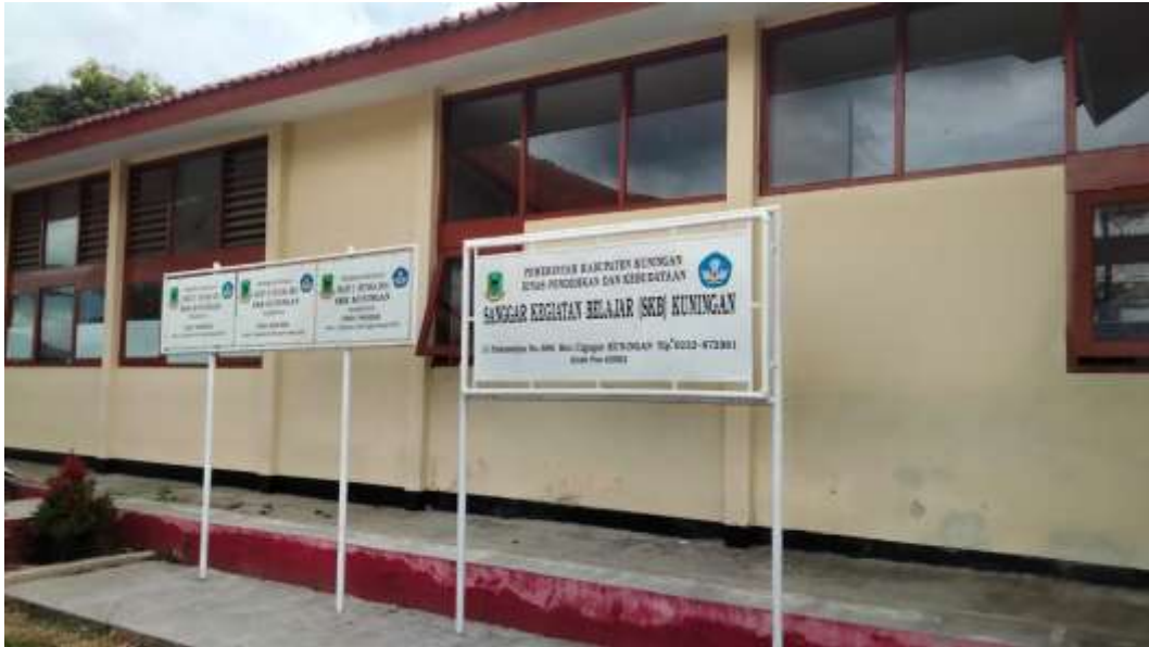
Gambar 3.2 Tempat Penelitian