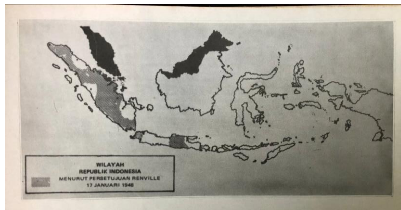
Gambar 2.3 Wilayah Indonesia setelah Perjanjian Renville

Hasil dari Perjanjian Renville delegasi Indonesia menyetujui gencatan senjata disepanjang Garis Van Mook yang merupakan garis penghubung titik-titik pihak Belanda yang dibelakang garis tersebut terdapat wilayah Republik Indonesia. Titik permasalahannya adalah Garis Van Mook yang tidak diterima oleh Republik Indonesia justru disetujui oleh Amir Syarifuddin sebagai delegasi Indonesia. Wilayah yang termasuk kedalam Garis Van Mook terdapat Jawa Barat, hal ini karena Jawa Barat merupakan wilayah yang diperhatikan perkembangannya oleh pihak Belanda untuk mendirikan negara Pasundan. 37 Maka dari itu, Divisi Siliwangi ditarik mundur dari Garis Van Mook.