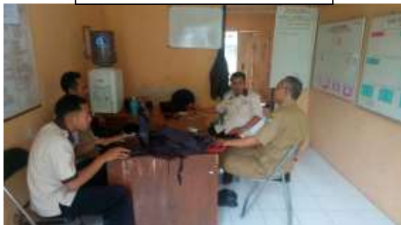
Diskusi Pelaksanaan PKH