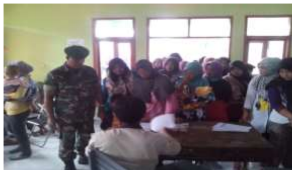
Pencairan Dana PKH