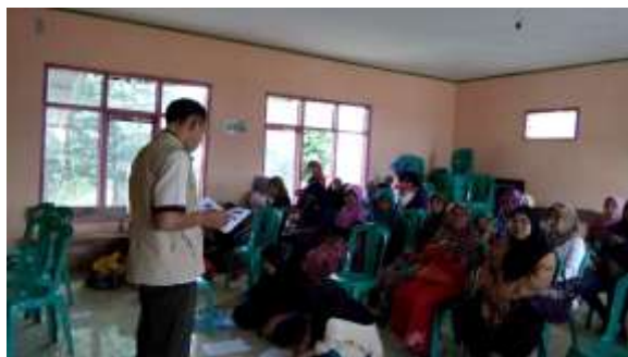
Sosialisasi Program PKH