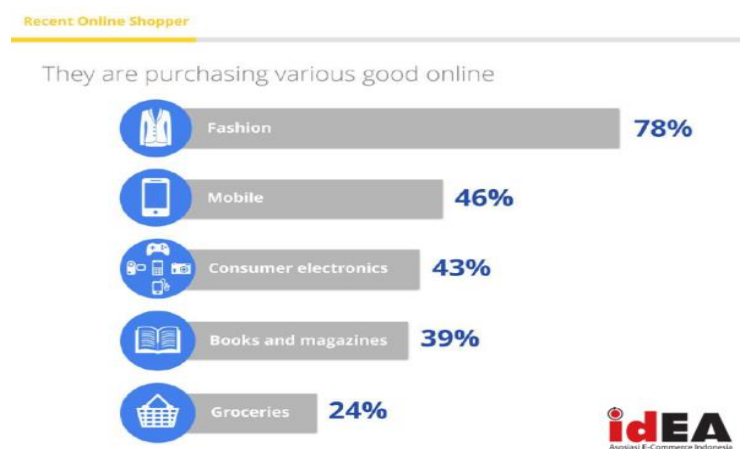
Gambar 1.2, Data Produk Yang Sering Dibeli Secara Online.

Menurut idEA (Assosiasi E-commerce Indonesia) produk yang sering dibeli secara online adalah produk fashion.