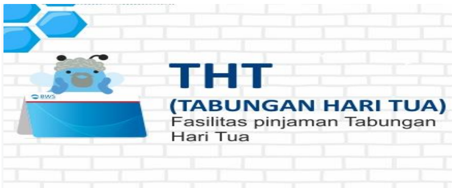
Gambar 3.7 Kredit Tunjangan Hari Tua

Kredit THT merupakan pinjaman yang diberikan Bank Woori Saudara kepada pensiunan yang memiliki tunjangan hari tua. Melalui Kredit THT Anda bisa mendapatkan fasilitas kredit, baik untuk keperluan konsumtif atau untuk modal berwirausaha. Dengan pelayanan dan proses pencairan kredit yang cepat dan jangka waktu pengembalian yang disesuaikan dengan kemampuan Anda.