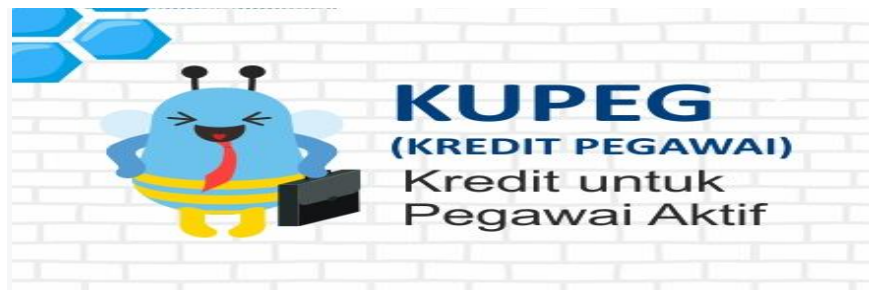
Gambar 3.5 Kredit Pegawai

KUPEG (Kredit Pegawai) ini digunakan untuk berbagai keperluan (multi guna) yang sifatnya primer maupun sekunder. Dengan pelayanan dan proses pencairan kredit yang cepat dan jangka waktu pengembalian yang disesuaikan dengan kemampuan Anda.