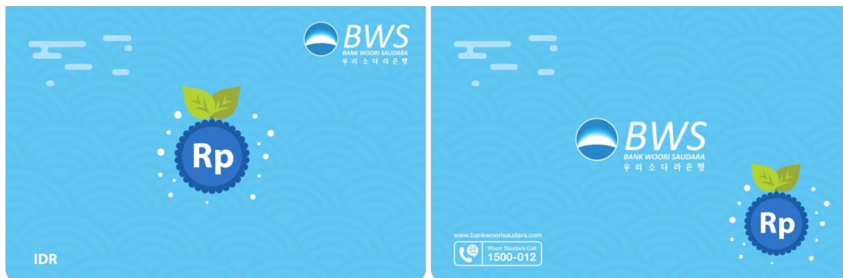
Gambar 3.1 Tabungan Bank Woori Saudara

Tabungan adalah Dana Pihak Ketiga kepada Bank yang penarikannya hanya dapat dilakukan menurut syarat-syarat tertentu.