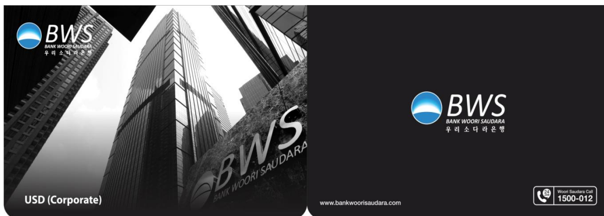
Gambar 3.2 Tabungan Woori Saudara Dollar

Produk Tabungan Woori Saudara Dollar merupakan sebuah produk Tabungan untuk perorangan dan non perorangan yang memberikan pilihan penyimpanan dana dalam bentuk mata uang asing, dengan setoran awal yang ringan dan bebas biaya administrasi.