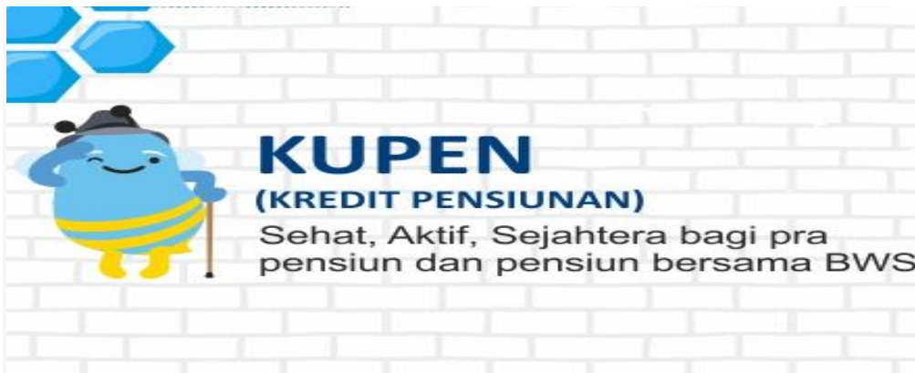
Gambar 3.6 Kredit Pensiun

KUPEN (Kredit Pensiun) merupakan pinjaman yang diberikan Bank Woori Saudara kepada pensiunan. Melalui KUPEN Anda bisa mendapatkan fasilitas kredit, baik untuk keperluan konsumtif atau untuk modal berwirausaha. Dengan pelayanan dan proses pencairan kredit yang cepat dan jangka waktu pengembalian yang disesuaikan dengan kemampuan Anda.