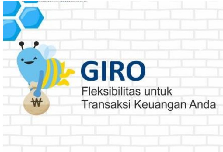
Gambar 3.3 Giro

dengan jenis transaksi dan setiap akhir bulan nasabah menerima laporan transaksi, yang disebut dengan Rekening Koran.