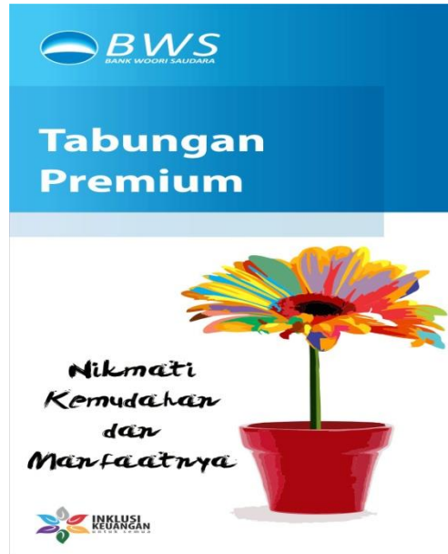
Gambar 3.2 Tabungan Premium

Syarat dan Ketentuan pembukaan rekening :