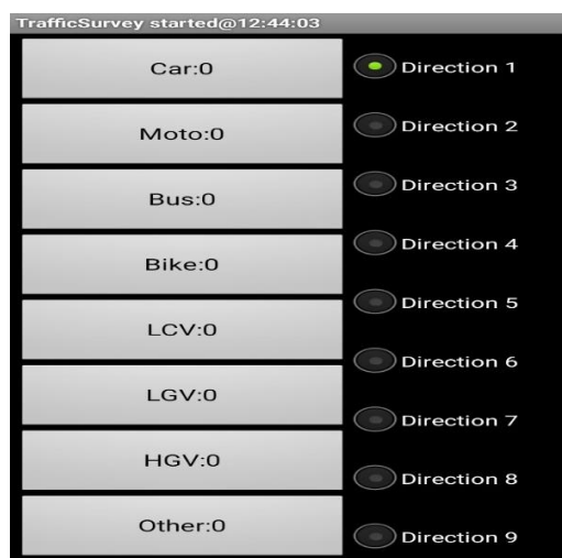
Gambar 3.7 Aplikasi traffic survey

aplikasi ini sangat membantu sekali karna sangat mempermudah surveyor dalam pengambilan data di tiga titik.