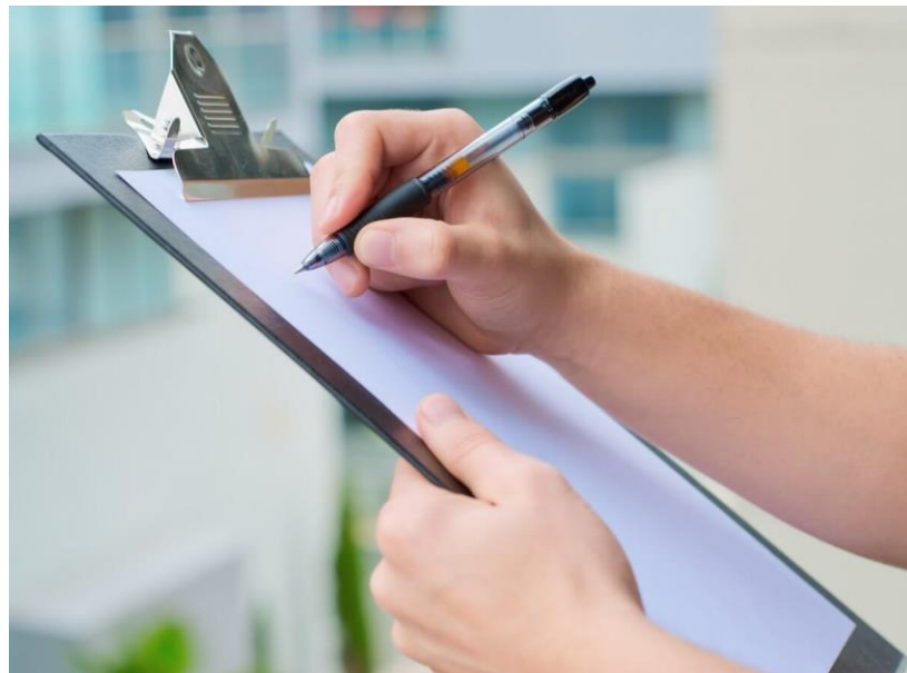
Gambar 3.2 Alat tulis survey

Peralatan ini sangat dibutuhkan untuk mencatat hasil dari penelitian dilapangan.