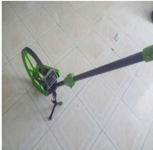
Gambar 3.6 Walking Distance Meter

Alat ini dipergunakan untuk mengukur ruas jalan pada persimpangan JL. MUKHTAMAR.