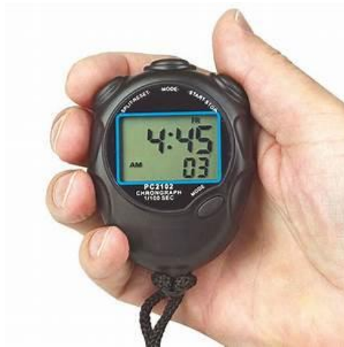
Gambar 3.4 Stopwatch

Alat ini digunakan untuk menghitung durasi waktu penelitian dalam waktu 15 menit sekali.