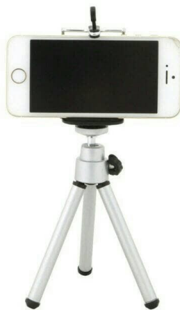
Gambar 3.5 Handphone

Digunakan untuk merekam situasi arus lalu lintas dalam keadaan sepi ataupun ramai.