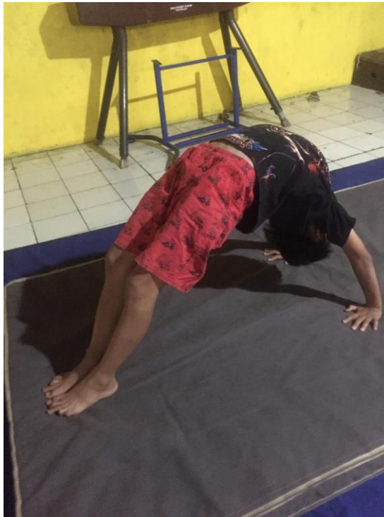
Gambar 3.3 Tes Back Handspring