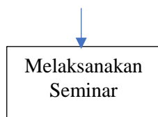
Gambar 3.1 Langkah-langkah Penelitian