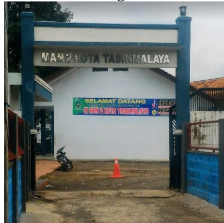
Gambar 3.4 Gambar Sekolah MA Negeri 2 Kota Tasikmalaya

Penelitian ini telah dilakukan di kelas X MIA MA Negeri 2 Kota Tasikmalaya yang beralamat di Pondok Pesantren Al-Misbah, Jl. Bantar, Argasari, Kec.Cihideung Kota Tasikmalaya.