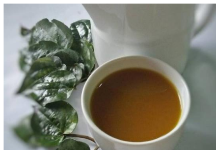
Gambar 2.6 :Ramuan jamu kunyit Sirih

Adapun contoh dari jamu yang dibuat dengan cara dihaluskan adalah jamu kunyit sirih. Dalam pembuatan jamu kunyit sirih bahan-bahannya terdiri dari Kg kunyit segar, 1 ikat daun sirih, 1/4 Kg temu kunci, 5 biji pinang, 1/2 Kg gula aren, 1/4 Kg asem jawa, Garam secukupnya, 3 Liter Air. Sedangkan cara pembuatannya adalah Cuci bersih kunyit, daun sirih dan temu kunci, Haluskan kunyit dan temu kunci, peras, Tambahkan daun sirih, biji pinang yang sudah dimemarkan, gula aren dan asem jawa, rebus sampai mendidih Saring dan dinginkan. (Yuliati, et.all, 2015)