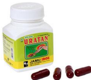
Gambar 2.3 Contoh Jamu pil