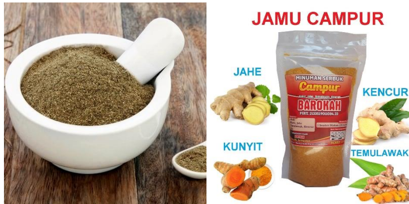
Gambar 2.2 contoh jamu jenis Sediaan serbuk seduhan