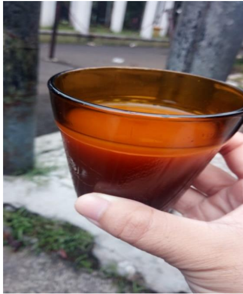
Gambar 2.4 Contoh Jamu Cair

Jenis jamu selanjutnya adalah berbentuk cairan. Salah bentuk jamu cair yang banyak beredar adalah jamu tradisional gendong. Jamu gendong dikemas dalam botol dalam bentuk cair yang tidak diawetkan dan diedarkan tanpa penandaan. Hal ini memungkinkan jamu gendong dapat diproduksi oleh siapa saja yang menghendakinya. Pengolahannya dilakukan dengan cara merebus seluruh bahan atau dengan mengambil sari yang terkandung dalam bahan baku, kemudian mencampurkannya dengan air matang. (Suharmiati, 2005).