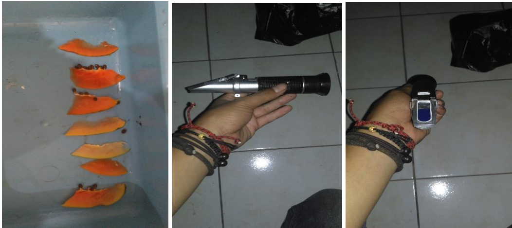
Gambar 9. uji total padatan terlarut