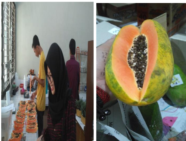
Gambar 8. uji organoleptik