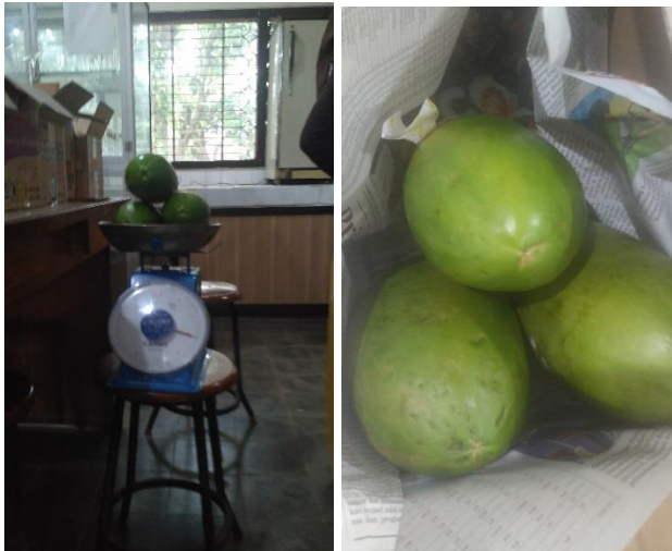
Gambar 7. pengamatan susut bobot