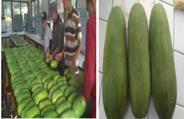
Gambar 3. kegiatan sortasi pepaya california