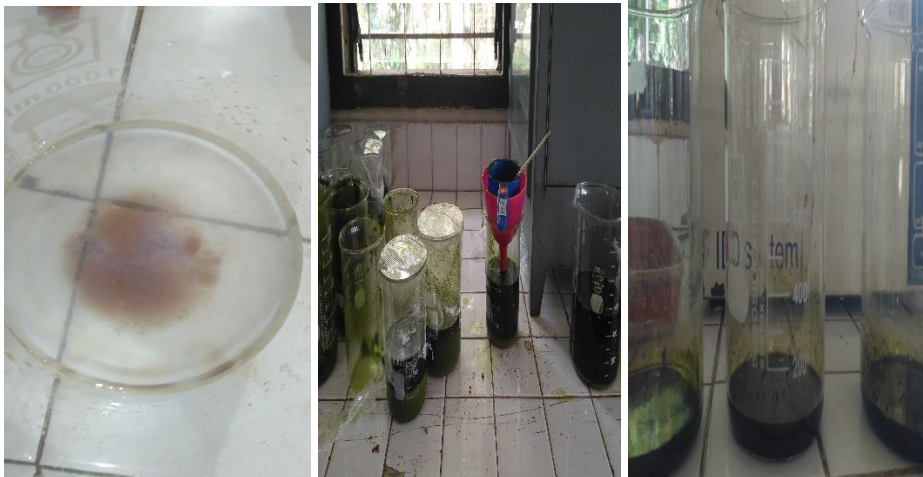
Gambar 4. pembuatan larutan edible coating