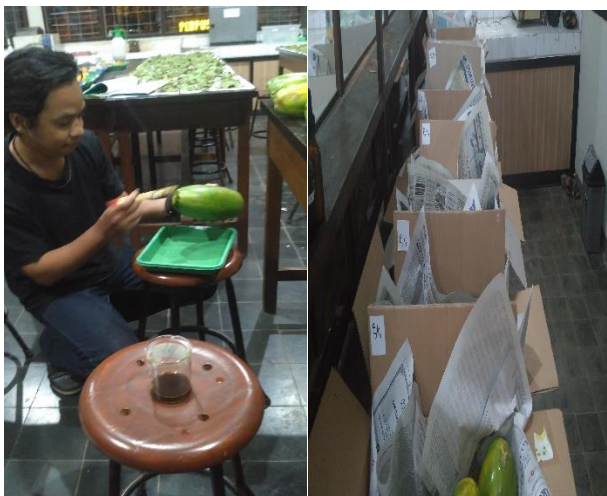
Gambar 5. kegiatan pemberian perlakuan