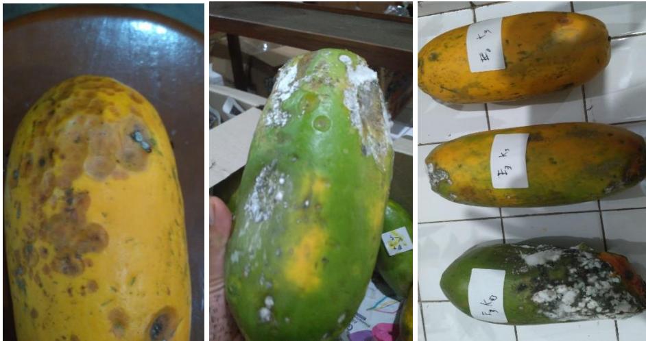
Gambar 6. pengamatan pertumbuhan antraknosa