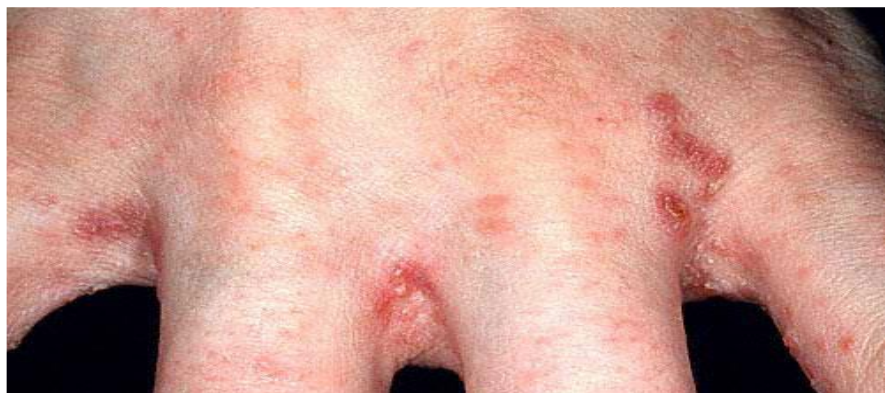
Gambar 2. 2 Gejala Klinis Skabies