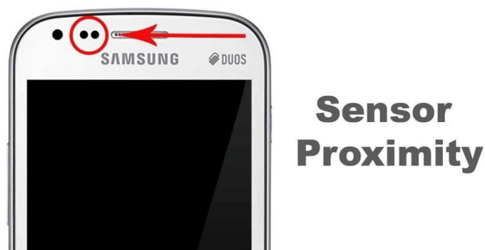
Gambar 2.2 Proximity Sensor

berlebihan. Sensor ini bekerja dengan bersinar seberkas, terlihat sebagai cahaya inframerah yang dipantulkan dari objek terdekat dan diterima oleh detektor cahaya.