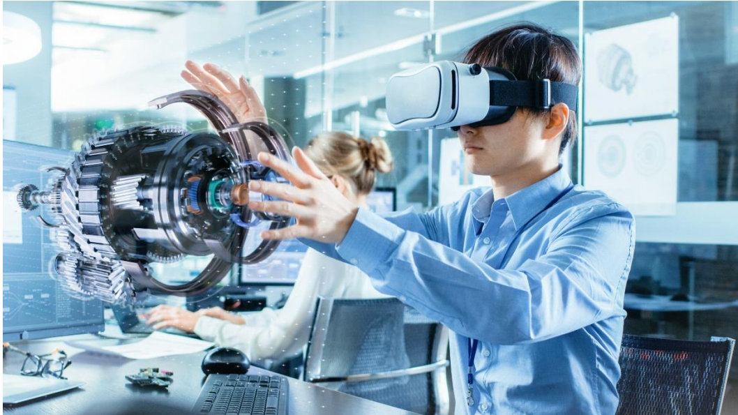
Gambar 2.1 Perangkat Virtual Reality

dibawah ini merupakan salah satu contoh perangkat Virtual reality .