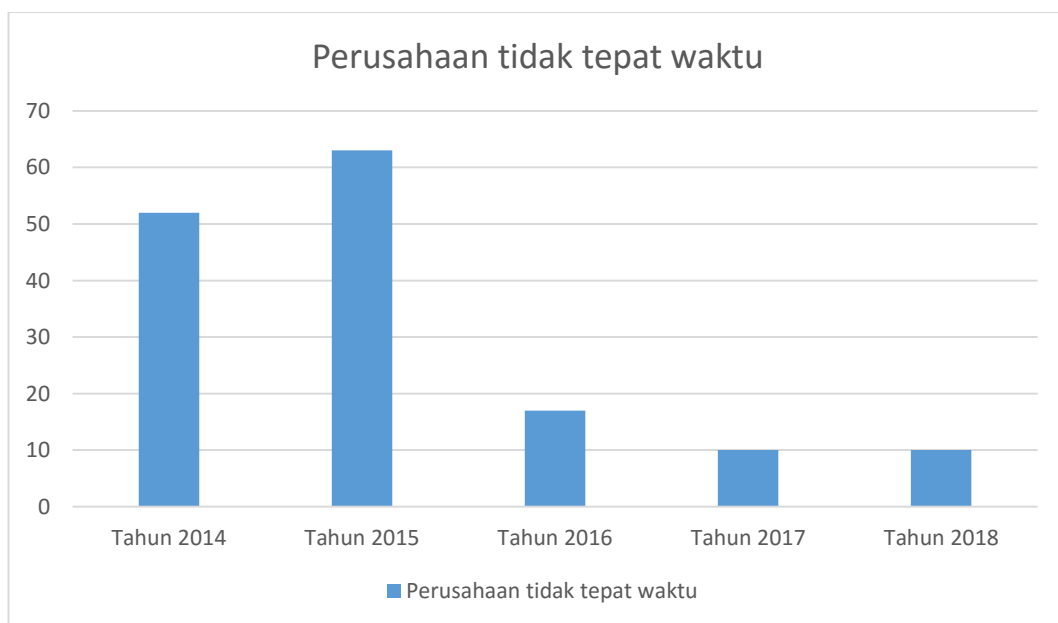
Gambar 1.2 Perusahaan terlambat sampaikan laporan keuangan (Sumber: www.idx.co.id . Data diolah penulis)

Meskipun peraturan kewajiban penyampaian laporan keuangan semakin ketat, namun sampai saat ini masih terdapat perusahaan publik yang terlambat dalam menyampaikan laporan keuangan. Berikut disajikan grafik keterlambatan penyampaian laporan keuangan tahun 2014 hingga tahun 2018 :