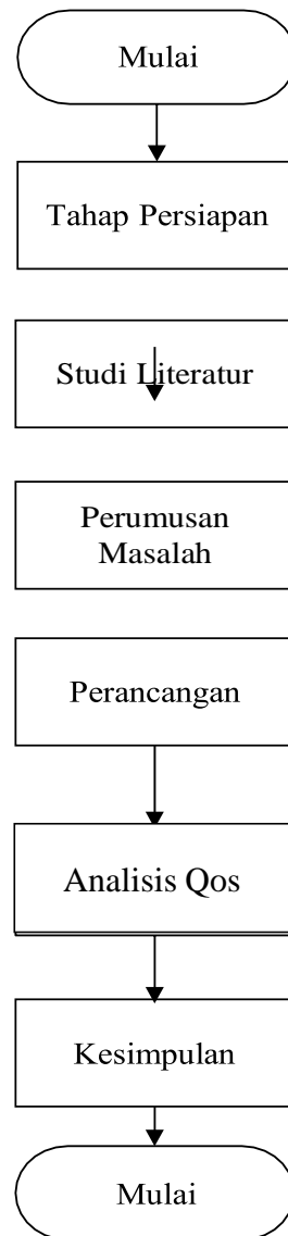
Gambar 3.1 Usulan Penyelesaian Masalah

Pada bab ini akan dipaparkan metodologi penelitian yang diuraikan menjadi masalah yang dihadapi dalam belakang dan tujuan penelitian. Hal tersebut digambarkan dan diuraikan pada diagram alir ( flowchart ) pada Gambar 3.1 berikut.